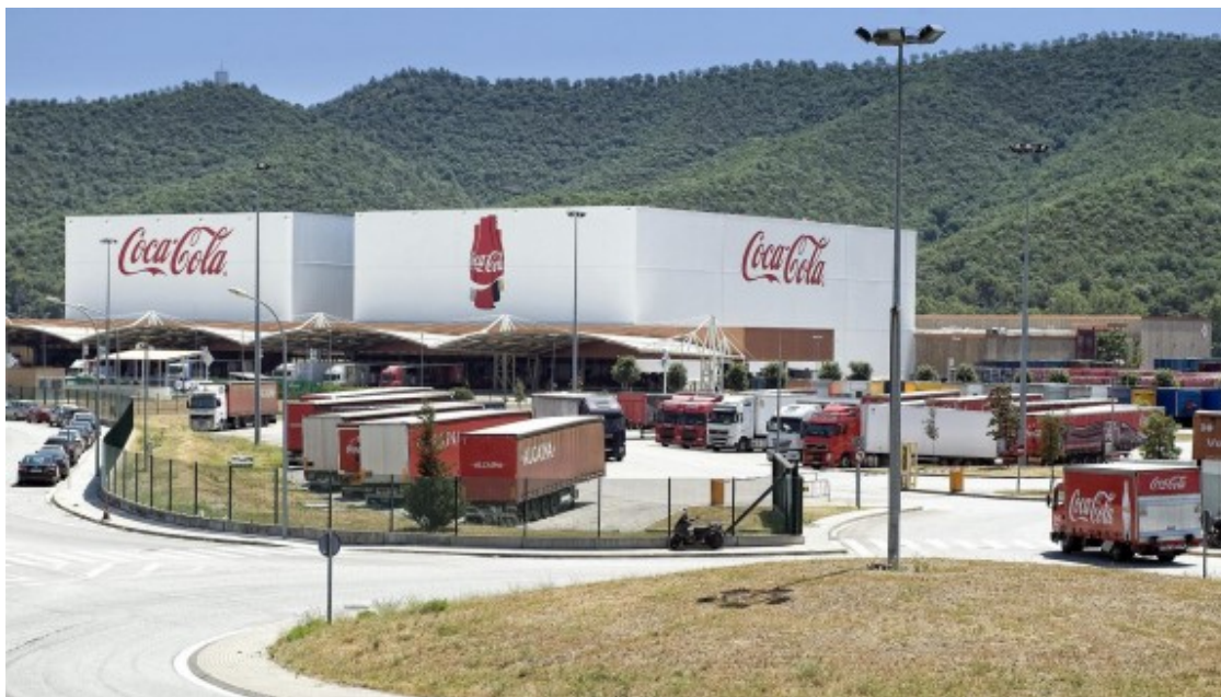
La planta de Coca-Cola de Martorelles.

L'abril de 2016, Sol Daurella aconsegueix sortir absoluta de la demanda dels treballadors de la planta de Cacaolat de Saragossa, que havien denunciat l'empresa per una presumpta estafa en el tancament de la factoria. En aquell cas, l'empresària va haver de prestar declaració als jutjats de la capital aragonesa.