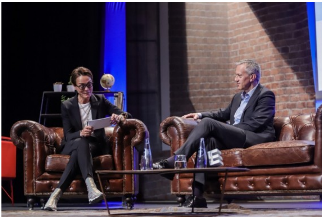
La presidenta de Coca-Cola European Partners, Sol Daurella, entrevista al president mundial de The Coca-Cola Company, James Quincey.