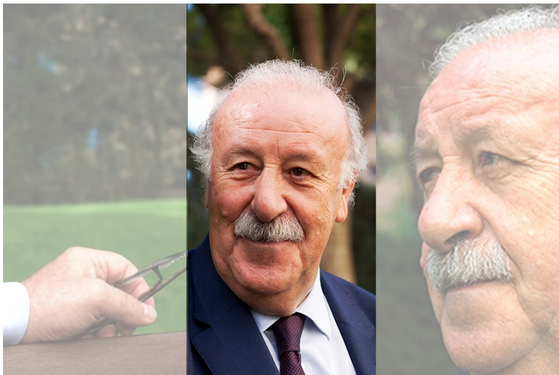
Vicente del Bosque | Alma, la xarxa social social

Les reflexions sobre integració de l'entrenador de futbol i pare d'un noi amb Down