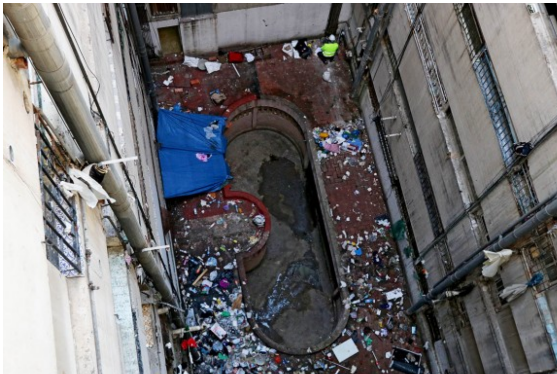
Celobert del bloc Venus de la Mina.

"Jo no crec en res. Ni en els polítics, ni en la justícia, ni en res. No crec en res ni ningú. Ho estem veient. La via política és lentíssima i fa tres anys que esperem una sentència ferma per la via judicial. Podem creure en alguna cosa? Jo només crec en el que tinc a la butxaca", conclou Jiménez, per a qui viure a la Mina ha deixat de ser una opció. Un barri a tocar de la capital, però que les administracions es miren des d'una distància planetària.