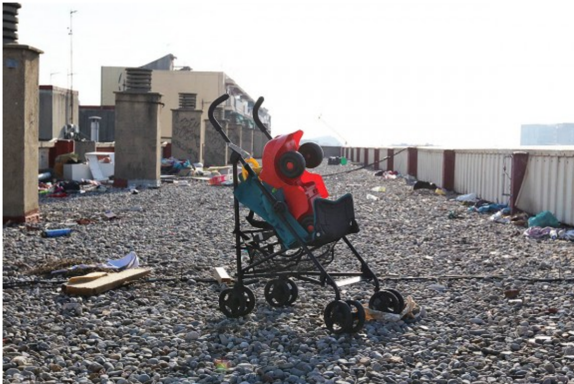
El terrat del bloc Venus de la Mina.

Pel camí de tornada, la sort deixa de somriure i l'ascensor no respon. El Jose baixa per les escales a les fosques, ja que la instal·lació elèctrica ha tornat a fallar.