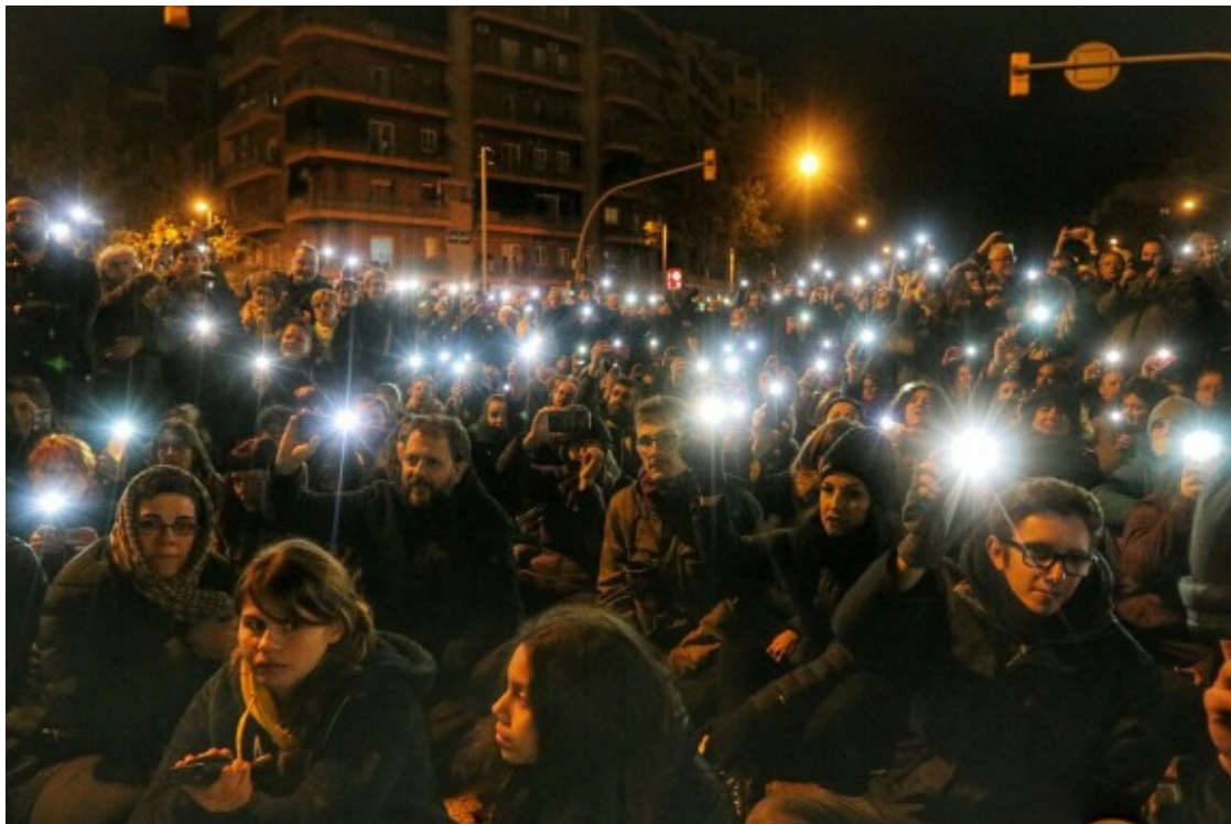
Els veïns de Sant Andreu fa més d'un mes que tallen la Meridiana.