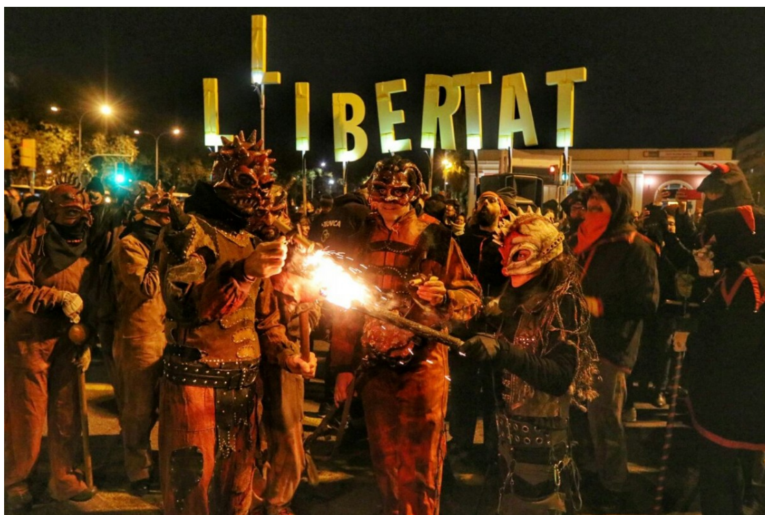
Els Diablers de Sant Andreu van participar al tall de la Meridiana

Veïns de Sant Andreu col·lapsen cada dia una de les artèries principals de Barcelona per protestar contra la sentència del Suprem i per demanar la llibertat dels presos