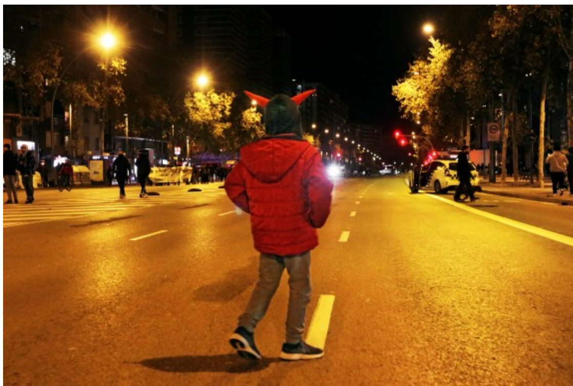
Una imatge del tall a la Meridiana del divendres 15 de novembre.