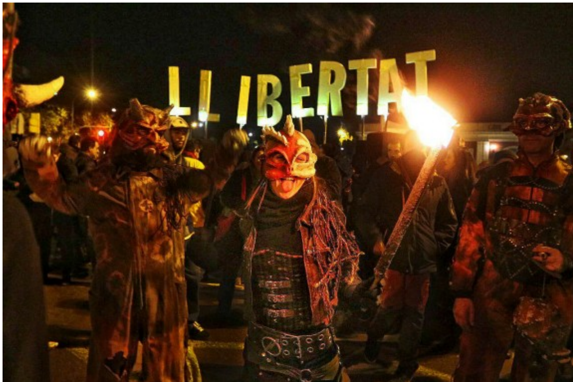
Una colla de diables va participar en el tall del divendres 15, quan la protesta feia un mes.

Marisa, veïna de Gràcia d'uns seixanta anys, acudeix al tall de la Meridiana per primer cop per "veure en directe" la protesta. "És una més de les convocatòries contra la sentència i per la gent detinguda i judicialitzada. Cada dia cau gent i és una manera de visibilitzar la situació", explica.