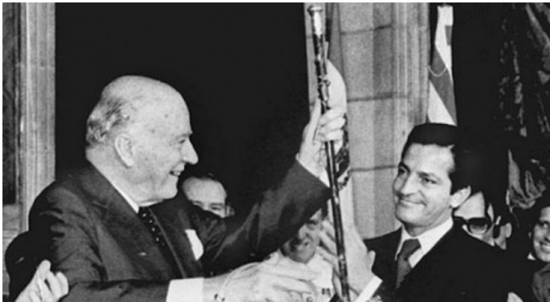
Tarradellas, el dia que fou investit president de la Generalitat.

L'assassinat de Companys va deixar la presidència de la Generalitat en mans de Josep Irla, titular de la presidència del Parlament, que com totes les institucions catalanes estava dispers per l'exili. Irla era un dirigent destacat del republicanisme gironí, d'idees federalistes i lliurepensadores. Va exercir la presidència fins al 1954, quan, ja malalt, va renunciar. Els diputats catalans a l'exili van elegir, a l'ambaixada de la República espanyola a Mèxic, nou president: Josep Tarradellas.