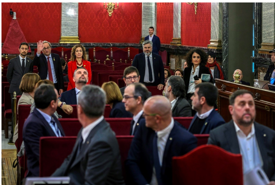
Torra saluda els presos en la primera sessió al Tribunal Suprem