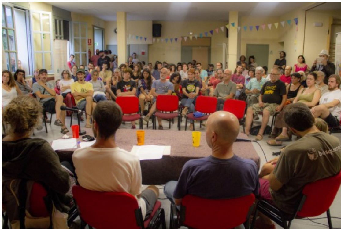
Taula rodona sobre la nova pagesia i el relleu generacional en clau d'economia social al FESS Rural 2019.

El nou paradigma agrosocial està caracteritzat, segons Monllor, per vuit components: escala local, diversitat, medi ambient, cooperació, innovació, autonomia, compromís social i alentiment. Uns components molt en sintonia amb els criteris de l'economia social i solidària.