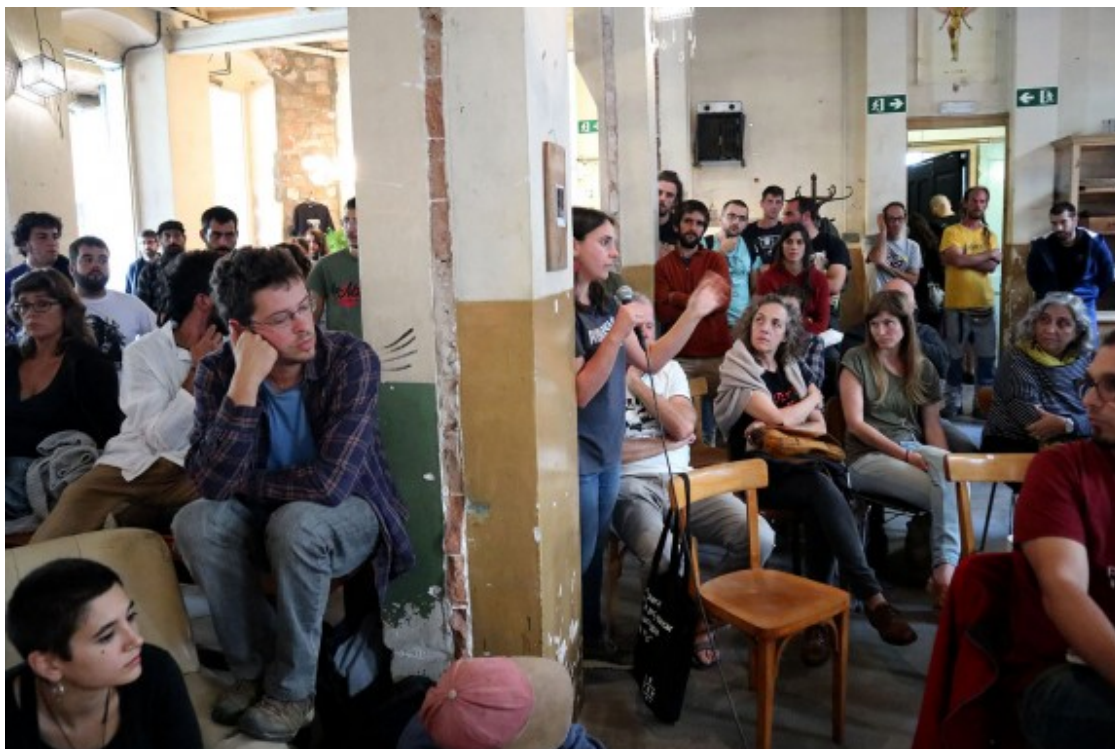
Debat entre el públic que omplia les sales del Konvent de Cal Rosal durant la jornada sobre «Ruralisme i emergència climàtica».

Pel que fa a les actituds de la nova pagesia vers un nou paradigma agrosocial, Monllor remarca que el 96,8% creu que el futur s'ha de centrar més en l'escala local que en la global, i el 93,6%, que s'han de recuperar les varietats i races tradicionals. Amb relació a la cooperació, un 96,8% creu que hi hauria d'haver una col·laboració més forta entre la pagesia. I finalment, en relació a l'alentiment, el 64,5% creu que no cal intensificar la producció per augmentar els beneficis, i un 77,4% que no cal ser gran per ser competitiu.