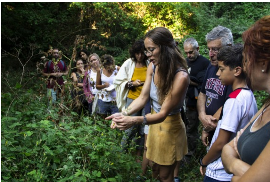
Una de les activitats de descoberta de l'entorn al FESS Rural 2019, a Vallfogona de Ripollès.

Un fenomen similar al que el 5 d'octubre es va donar al Konvent de Cal Rosal, en el que ha estat l'acte més multitudinari organitzat per l'Ateneu Cooperatiu de la Catalunya Central en els seus tres anys de funcionament. La jornada "Ruralisme i emergència climàtica" ( http://www.coopcatcentral.cat/2019/09/24/lateneu-cooperatiu-organitza-la-jornada-ruralisme-i-emergencia-climatica-al-konvent-de-cal-rosal/ ) va deixar petites les sales de l'antic convent berguedà autogestionat actualment des d'una associació cultural.