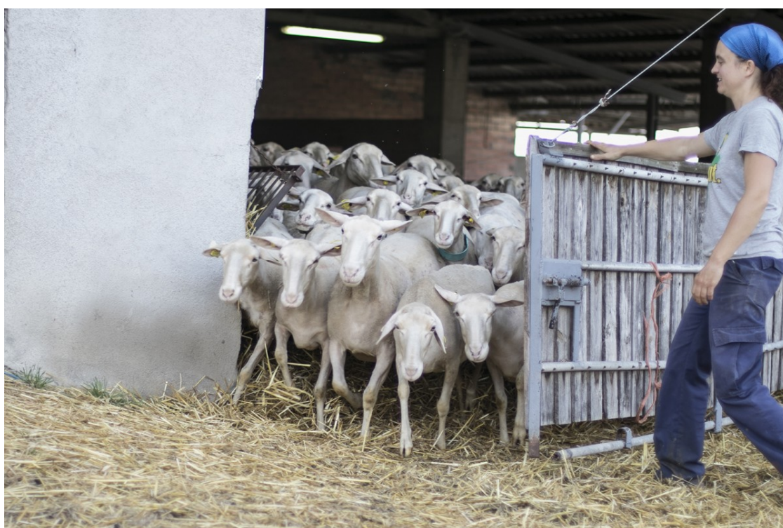
El ramat del Serradet de Barneres, projecte agroecològic de Sant Martí de Sescorts, sortint del corral

Tres jornades al Solsonès, el Ripollès i el Berguedà apunten a un nou paradigma agrosocial i a tímids canvis de tendència en el món rural a partir dels principis de l'economia social i solidària