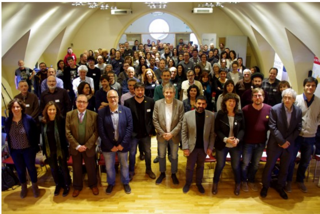
Participants a la trobada d'ateneus cooperatius i grups d'acció local a Solsona, presidida pels consellers El Homrani i Jordà.

Però la trobada de Solsona, que va servir per posar negre sobre blanc al que en realitat ja eren espais de col·laboració entre ateneus i grups d'acció local, no ha estat l'únic símptoma que els criteris de l'economia social i solidària poden exercir de taula de salvació en el camp català. Més enllà del treball que s'està fent des d'ARCA per generar ocupació a partir de la línia estratègica d'agricultura social. O del grup d'agroecologia que desenvolupa un dels eixos de treball principals dels ateneus cooperatius.