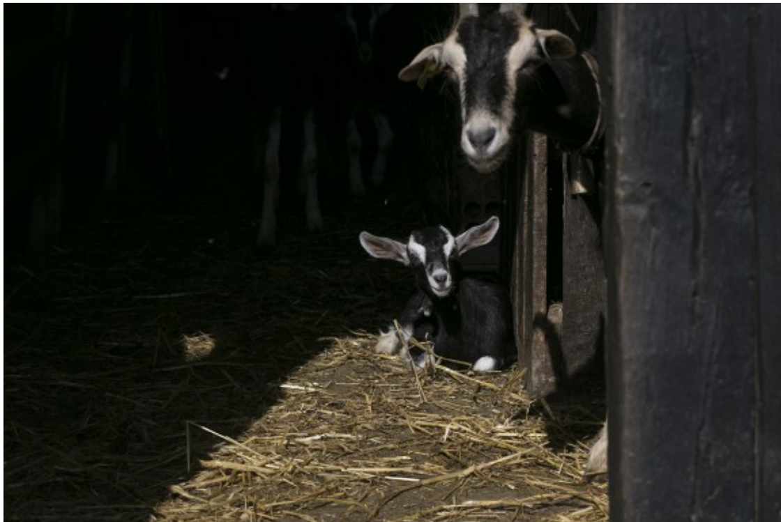
Cabres de la masia de la Vall, una explotació de ramaderia ecològica de Sant Pere de Torelló.

l'economia social a l'àmbit rural" ( http://aracoop.coop/wp-content/uploads/L_espai_test_agrari_promotor_deconomia_social_ambit-rural_Anna-Angli.pdf ) . L'aleshores alumna del postgrau de Gestió de Cooperatives i Empreses d'Economia Social del Tecnocampus de Mataró i actual coordinadora de Katuma SCCL, una plataforma cooperativa de consum de proximitat, partia en el treball d'un diagnòstic no precisament engrescador: ?El model agrícola català està en perill d'extinció?.