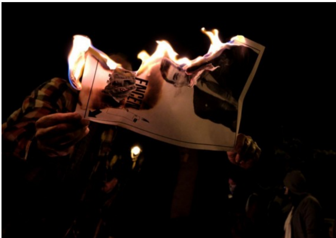
Els manifestants cremen una imatge del rei Felip VI fora del Palau de Congressos.

Aquests valors citats per Felip VI representen, segons ell, "la millor història de Catalunya". "No poden ni han de ser un record del passat, sinó una realitat efectiva del nostre present i del nostre futur", ha ressaltat el monarca, rebut amb protestes nombroses a la Diagonal de Barcelona. El rei ha apuntat que els joves "no poden viure aïllats, reclusos en fronteres impermeables", i ha definit Espanya com un "Estat democràtic i constitucional". Segons ell, fa quaranta anys el "poble" va decidir "retrobar-se per convidaure junts i en llibertat sota principis democràtics".