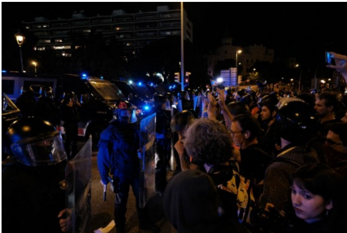
Protestes per la visita de Felip VI a Barcelona

Ahir a la tarda, coincidint amb l'arribada de Felip VI, centenars de persones ja van congregarse a l'avinguda barcelonina, que es va haver de tallar circumstancialment durant la manifestació. La setmana passada, el mateix Palau de Congressos va acollir la posada en marxa de l'Assemblea de Càrrecs Electes, convocada pel Consell per la República i que suposa l'últim intent per recuperar la unitat independentista