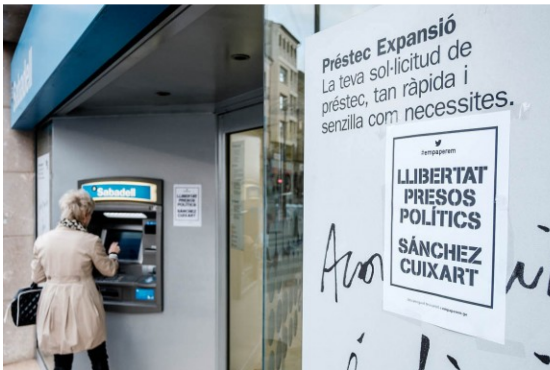
Cartell independentista en una oficina del Banc Sabadell.