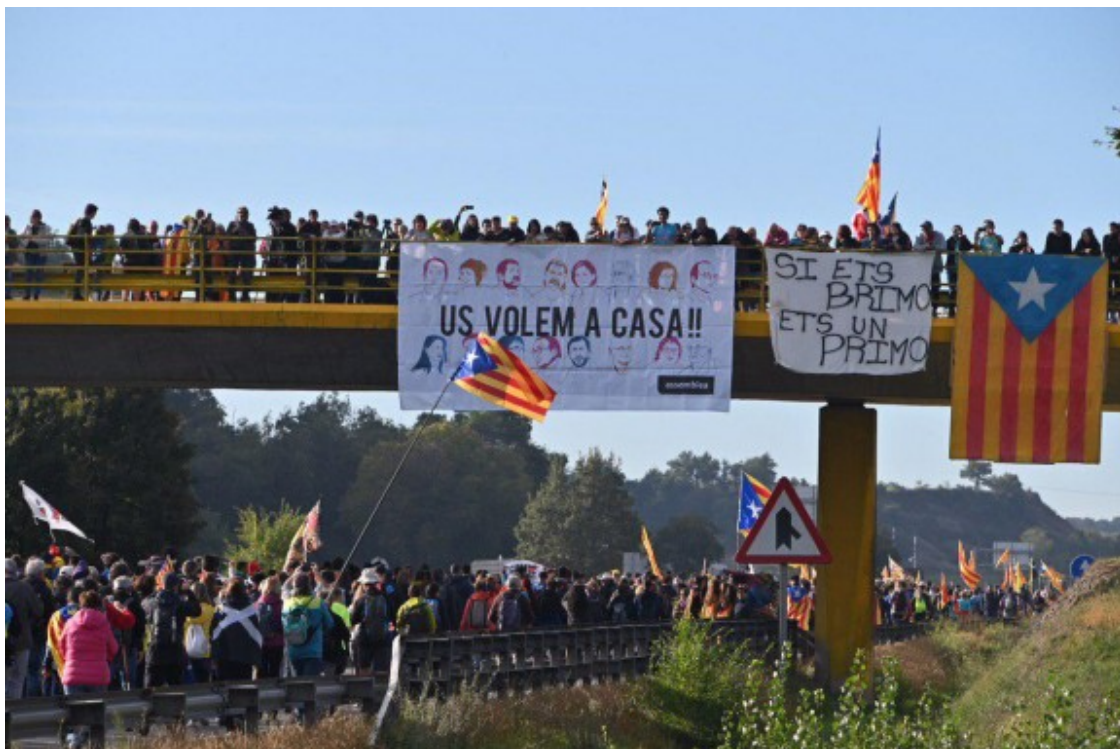
La C-17 plena a vessar per milers persones. Foto: Josep M. Montaner