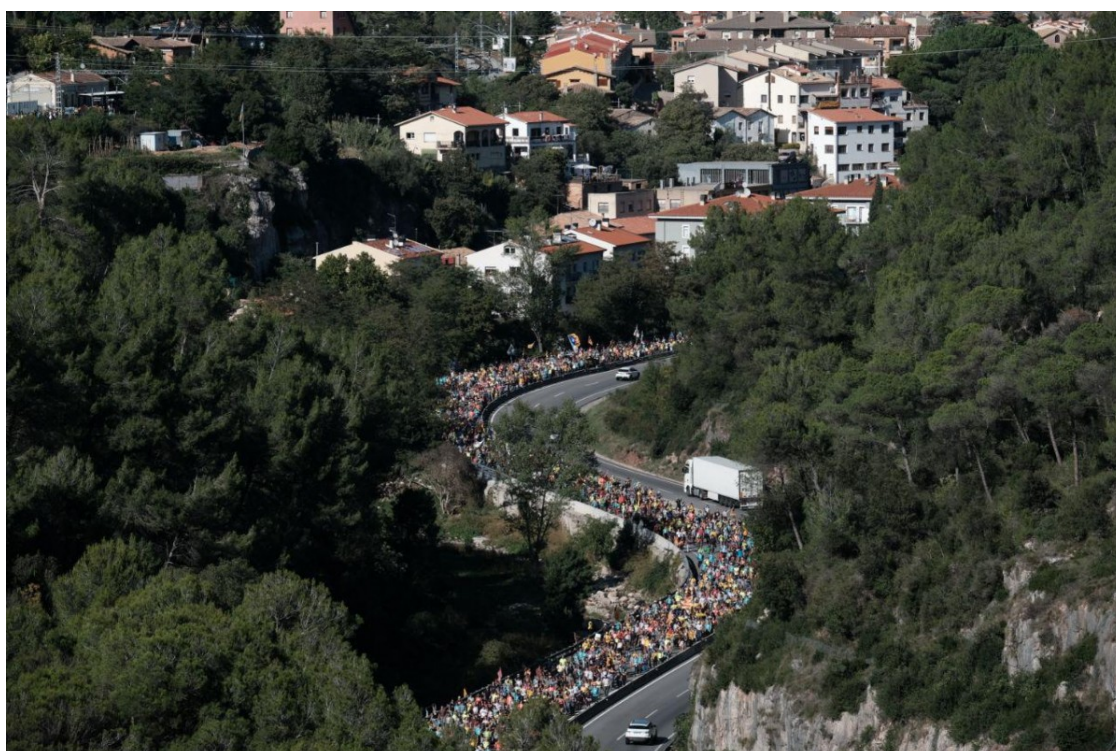
La Marxa per la Llibertat per la C-17 a Tagamanent. | Adrià Costa

Milers de persones han sortit de Vic a primera hora d'aquest matí per recórrer durant tres dies la C-17 i l'AP-7 fins a Barcelona