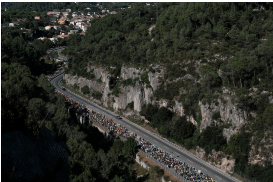
La Marxa per la Llibertat per la C-17 a Tagamanent