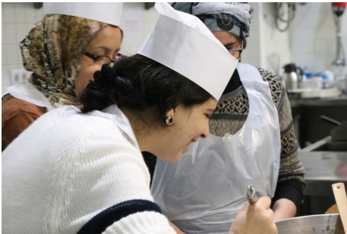
Dones participants en el programa de reincorporació laboral de la Fundació Surt.