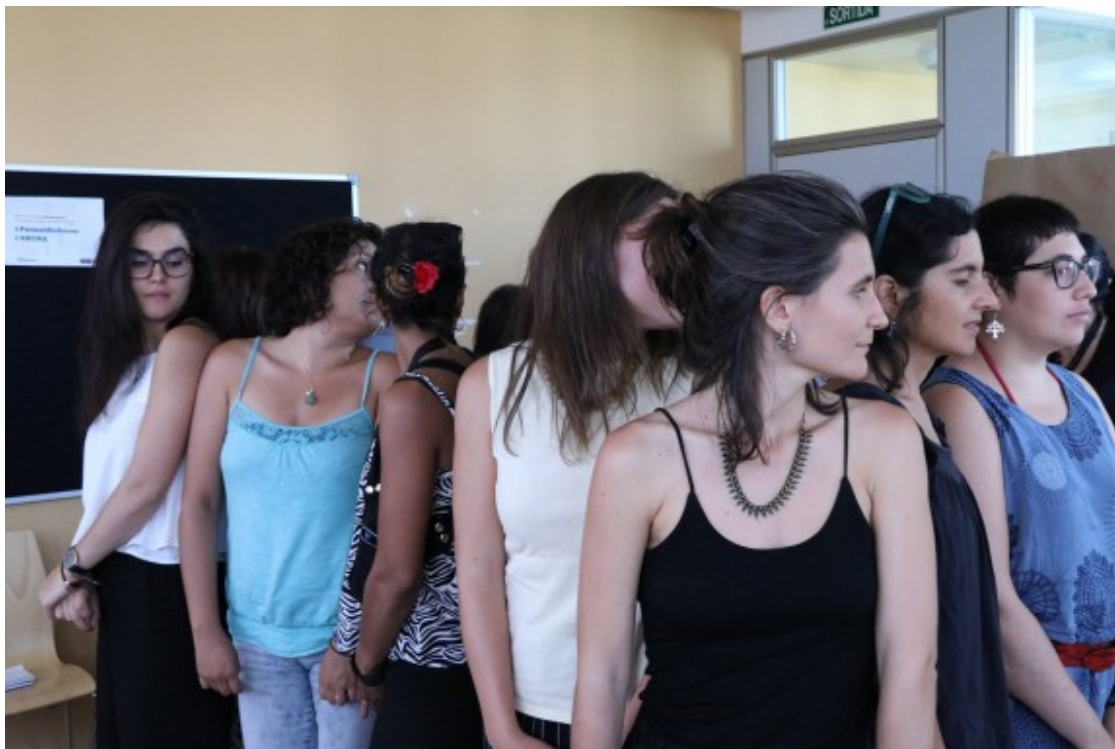
Una de les activitats d'empoderament comunitari impulsada per la Xarxa Antirumors de Barcelona en col·laboració amb la Fundació Surt.

Ramos destaca la importància de les cures dins les entitats d'economia social i solidària, i el concepte d'entitats habitables: ¿Hi ha entitats molt grans, d'àmbit estatal, molt solvents i amb molta experiència, que te'n faries creus. El discurs cap enfora és molt clar, però portes endins hi ha molt per fer?. Segons Ramos, no és fàcil tot i haver-hi predisposició, com és el cas de la fundació, amb una direcció formada per dones i un equip majoritàriament femení: ¿Imagina't en entitats en què no hi ha dones a la direcció i que no tenen un discurs tan clar. No és que no es faci sinó que hi ha resistències per fer-ho?.