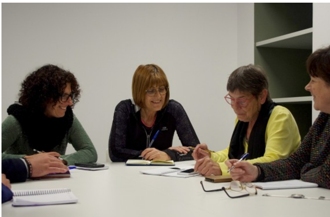
Reunió del Consell Rector de la cooperativa Cuidem Lluçanès, a l'Espai de Prats de Lluçanès.

?No entenen els avantatges d'estar contractades perquè cobren més en l'economia submergida?, assenyala Martínez, i remarca que hi ha un problema històric de fons, que és no donar valor a unes tasques que sempre s'han realitzat sense cobrar i que s'ha donat per fet que qui les feia eren les dones. ?Quan parlem del sector de les cures és difícil d'entendre que una persona estigui contractada i tingui les mateixes condicions laborals que una altra que treballi en un altre sector?. Segons Martínez, cal un treball de conscienciació de la societat i posar sobre la taula el tema de les cures i del treball reproductiu, ?donar-li el valor que té i equiparar-lo a qualsevol altra feina productiva?.