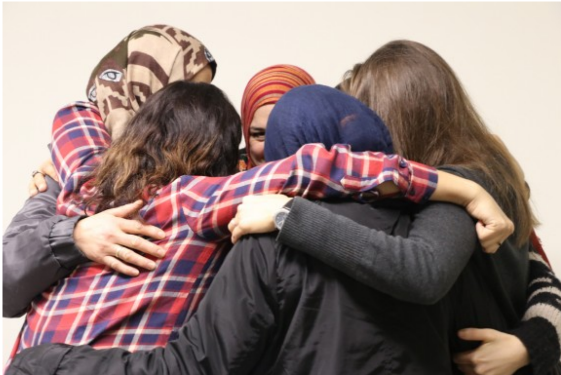
Sessió de treball al voltant del suport entre dones organitzada per la Fundació Surt.

El perfil de persona que atén la fundació és molt divers i, majoritàriament, es tracta de dones que es troben en situacions de vulnerabilitats, un percentatge molt alt de les quals es dedica al treball de cures i de la llar. Ramos destaca que, tot i que, d'una banda, tenen dones especialitzades en un servei d'atenció no valoritzat i que podria sortir al mercat i, de l'altra, una població envellida que necessita ser atesa, és molt difícil generar cooperatives de tot això, i més en un sector com el de les cures, en què la gent no està acostumada a pagar.