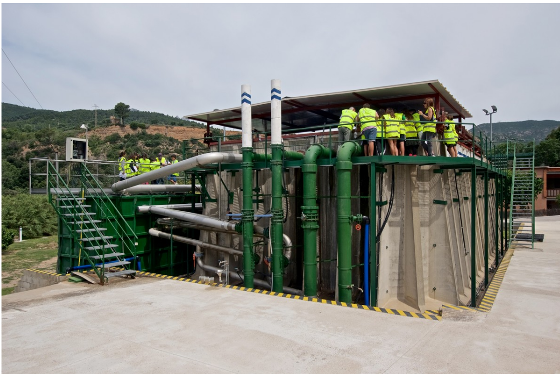
Visita d'estudiants a les instal·lacions de la planta potabilitzadora de la Comunitat Minera Olesana | CMO

La Comunitat Minera Olesana, l'única del país dedicada al servei d'aigua, la Cos i Cultural Rizoma, tres exemples de cooperatives en sectors econòmics estratègics