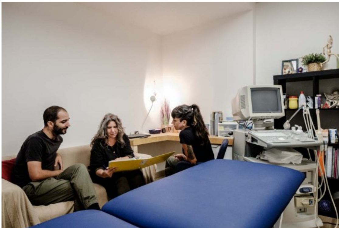
La Cos és una cooperativa de salut basada en la medicina integrativa.

¿Quan poses la persona al centre l'estàs responsabilitzant del seu procés de salut i l'estàs apoderant?. A més, també destaca que quan t'impliques en la iniciativa de què formes part adoptes una actitud més crítica i reflexiva, ¿no ets una mera consumidora del servei?.