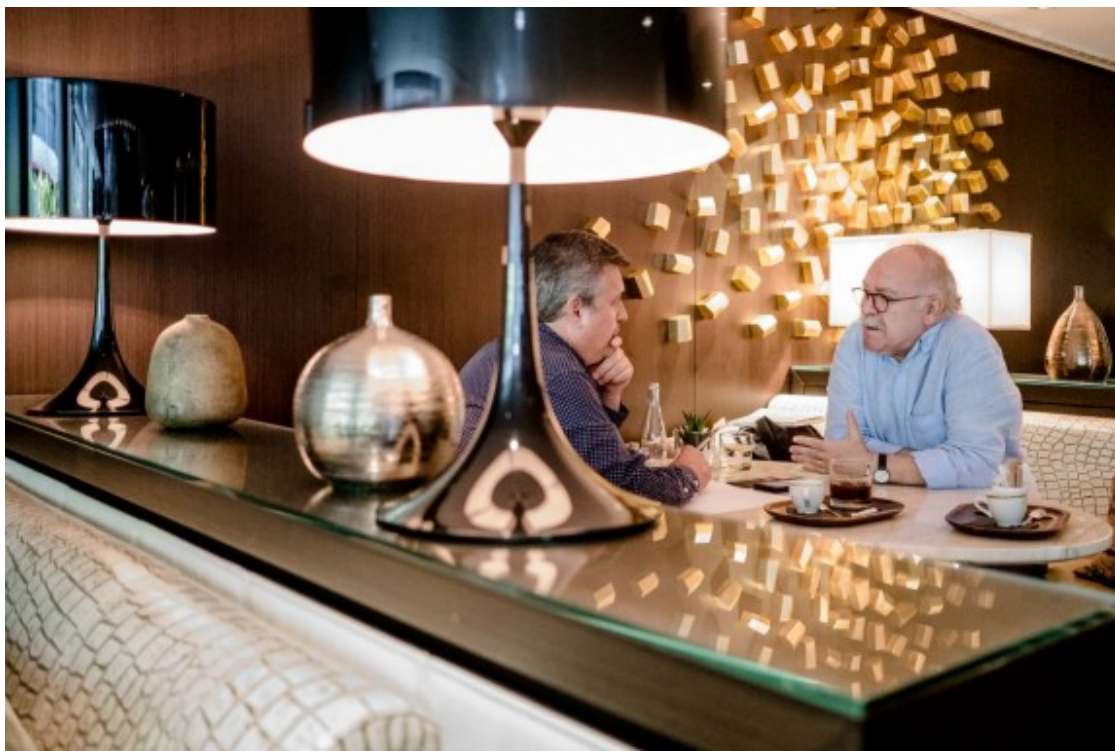
L'exvicepresident del Govern no milita a ERC des del 2011.