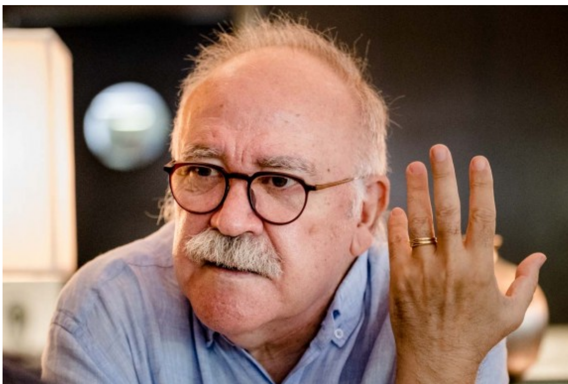
Carod-Rovira: "La meua etapa com a militant de partit s'ha acabat".

- Ui, no, no es tracta de militar o no a ERC. La meva etapa com a militant de partit s'ha acabat. ( https://www.naciodigital.cat/noticia/25593/carod-rovira/estripa/carnet ) Ja he fet la meua contribució des dels 18 anys i en tinc 67. Estic en desacord amb els discursos antipartit o antipolítica, però jo ja en tinc prou de partit.