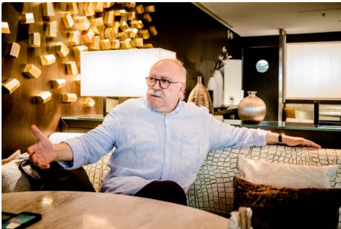
Josep-Lluís Carod-Rovira, en un moment de l'entrevista.