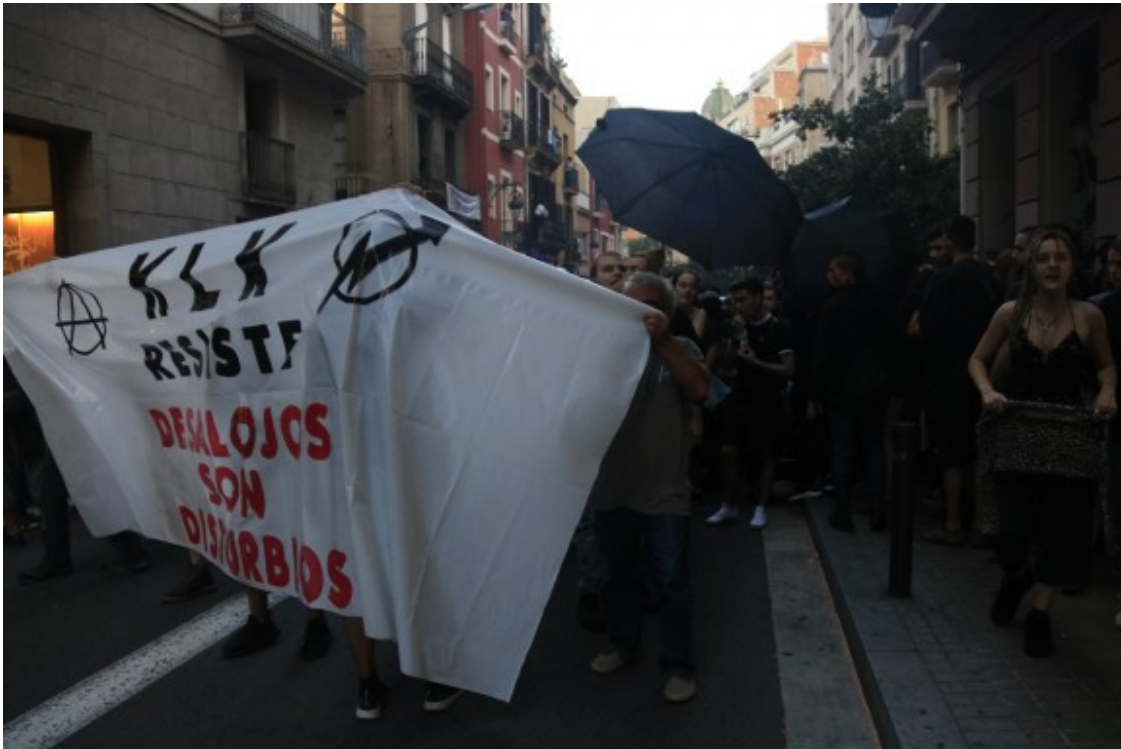
Una imatge de la manifestació.

Durant la manifestació, que ha recorregut diversos carrers del barri de Gràcia, els manifestants han cridat consignes com ara 'Ka la Kastanya resisteix' o 'No s'entén, gent sense cases i cases sense gent'. A les set de la tarda ja hi havia diverses furgonetes policials a la zona, i agents del cos de seguretat feien escorcolls i identificacions. Un helicòpter dels Mossos sobrevolava la zona en el marc del dispositiu policial.