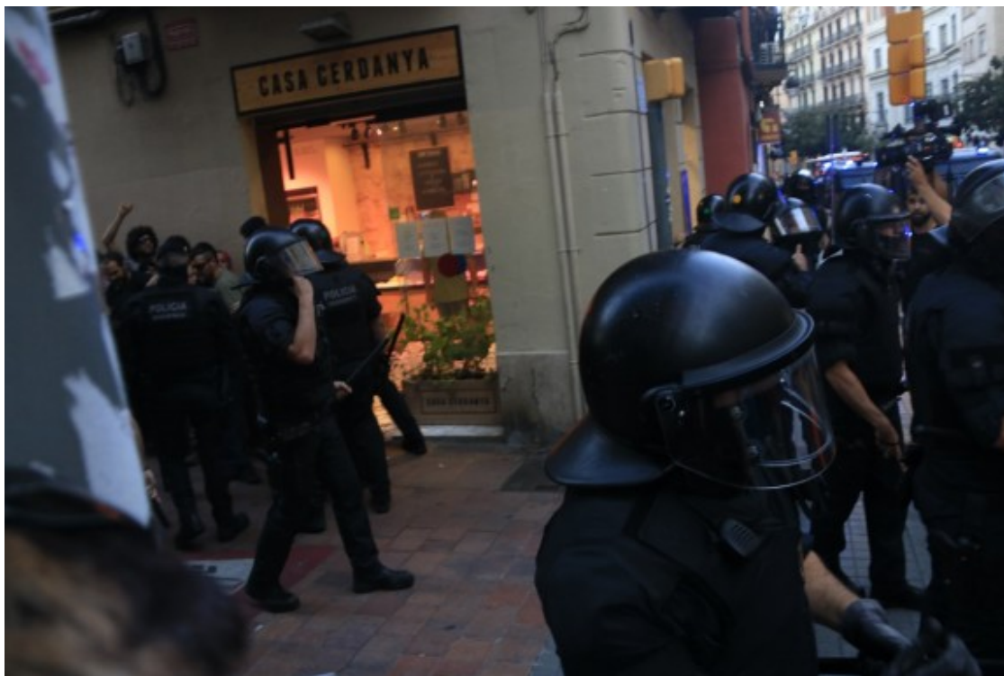
Els Mossos han desplegat un ampli dispositiu policial