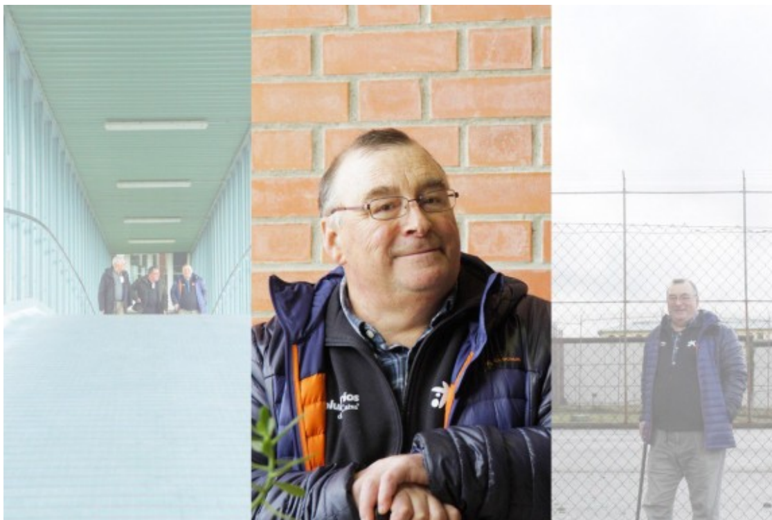
Un participant al projecte CiberCaixa Penitenciàries.

L'Anna és una força de la natura: una dona amb uns valors tan ferris que es mereix tota la meua admiració. Durant l'estada vaig viure a la fundació, com tota la resta, d'una manera molt austera, amb poca aigua, amb el menjar i els problemes del país: les carreteres, la manca d'infraestructures. També vaig anar a inaugurar orfenats, vaig visitar hospitals i vaig poder veure de primera mà que la feina dels voluntaris és totalment imprescindible per al nostre bé comú.