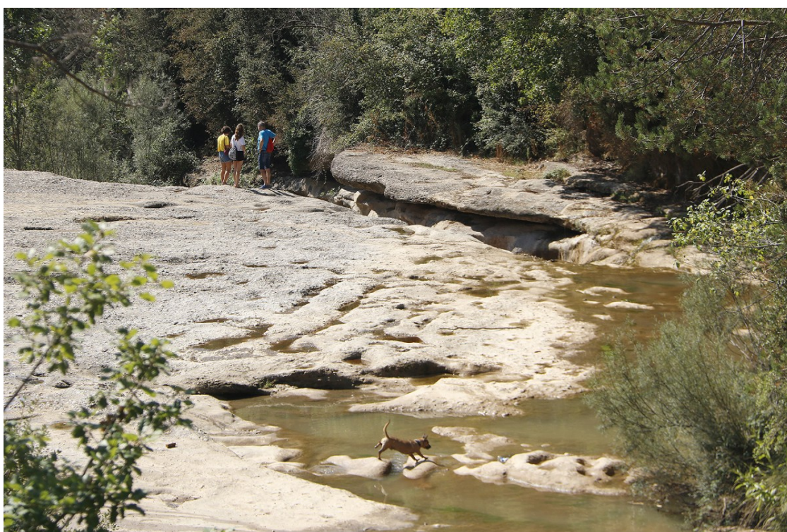
Uns excursionistes visitant la riera de Merlès amb el gos.

El cos d'Agents Rurals ha sancionat gairebé una cinquantena de persones entre juny i agost