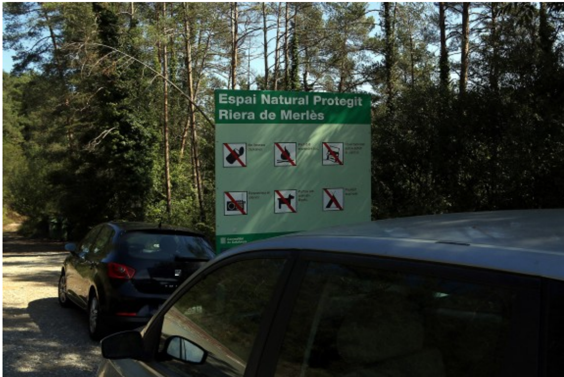
A l'entrada d'una de les zones de bany de la riera de Merlès