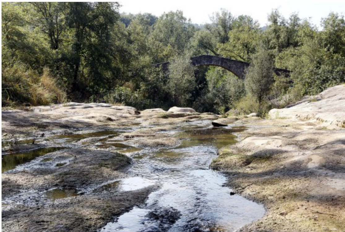
La poca aigua que hi ha a la riera de Merlès, al seu pas per Santa Maria de Merlès