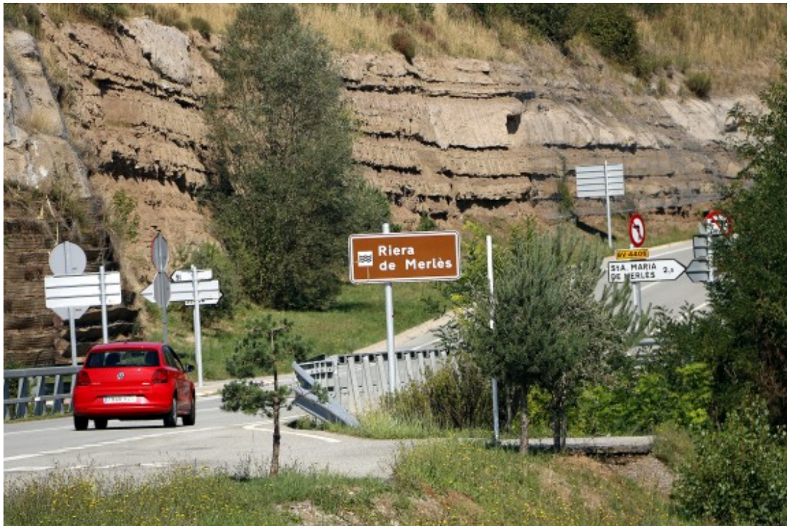
Una de les entrades cap a la riera de Merlès, al terme municipal de Santa Maria de Merlès.