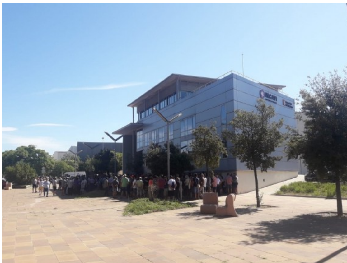
Protesta dels viticultors davant de l'INCAVI.

Tot plegat ha motivat que s'obri una reflexió global inèdita en el sector, si bé per ara els viticultors tenen poc marge de maniobra, com es va evidenciar el 22 d'agost en la cimera que va convocar la consellera d'Agricultura, Teresa Jordà ( https://www.naciodigital.cat/cupatges/noticia/5948/viticultors/no/podran/evitar/rebaixa/preu/raim/a/questa/verema ), per mirar d'acostar posicions entre pagesos i grans cellers.