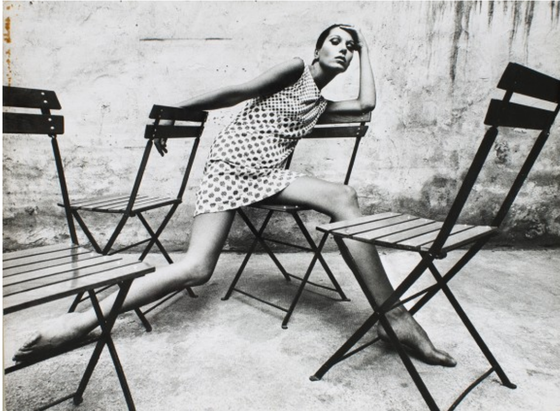
Oriol Maspons. Retrat d' Elsa Peretti, 1966. Museu Nacional d'Art de Catalunya, dipòsit de l'artista, 2011.

Cada vegada més, les models esdevenen uns simples maniquins, despersonalitzats, nines inexpressives en poses impossibles sobre fons blanc.