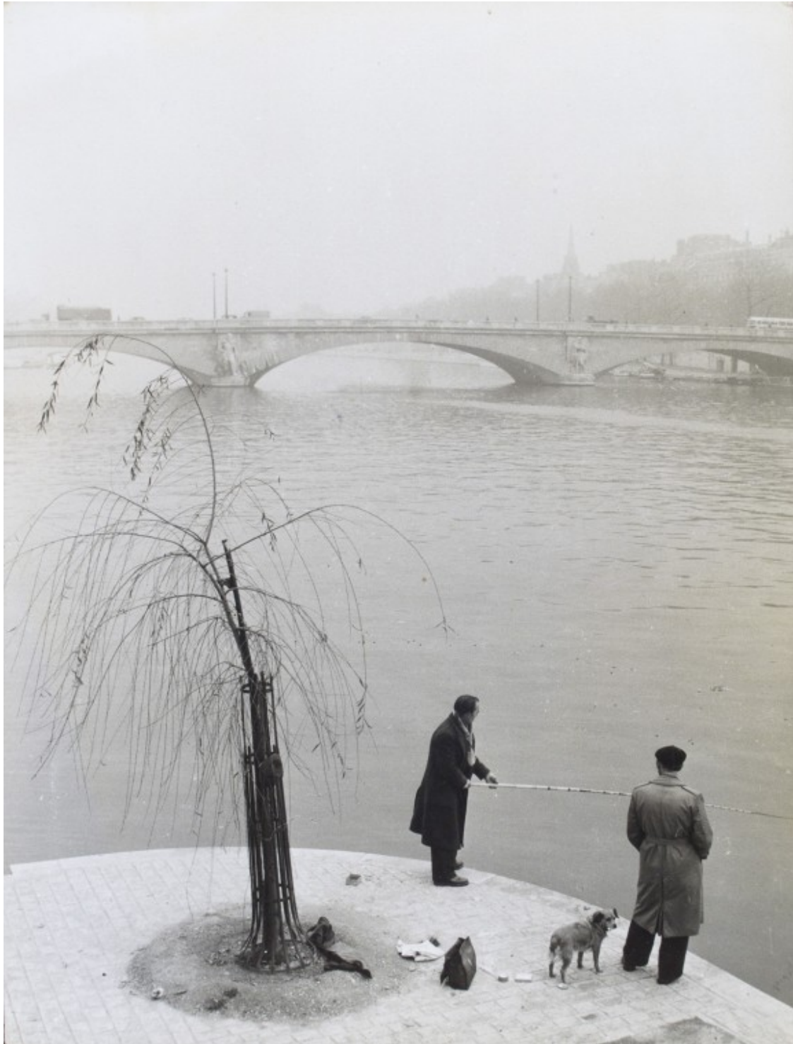
Oriol Maspons, París, c. 1955-1957. Museu Nacional d'Art de Catalunya, dipòsit de l'artista, 2011.