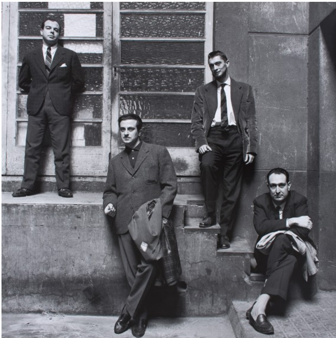
Oriol Maspons, Jaime Gil de Biedma, Carlos Barral, José Agustín Goytisolo i Josep Maria Castellet al vestíbul de l'editorial Seix Barral, 1961. Museu Nacional d'Art de Catalunya, adquisició finançada per la Fundació Nando i Elsa Peretti, 2017.