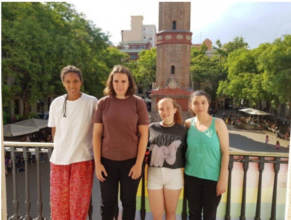
Les pregoneres de la festa major d'enguany