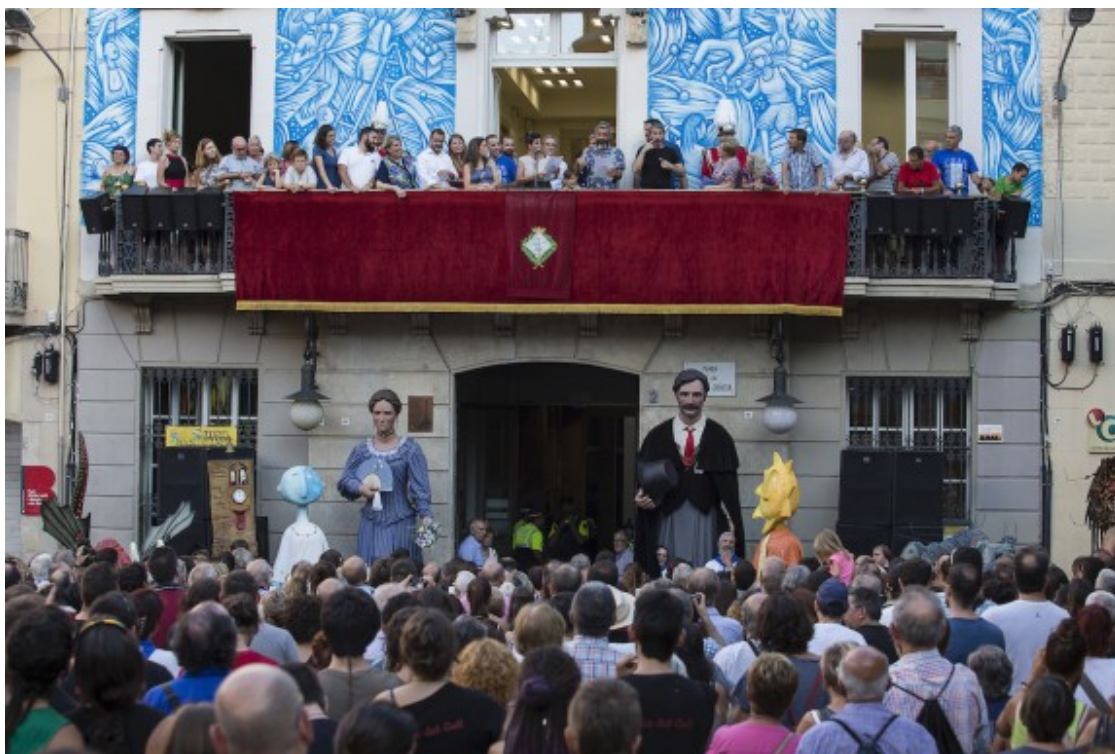
El pregó de la festa major de Gràcia

festa, el dia 21 al vespre, hi haurà el correfoc.