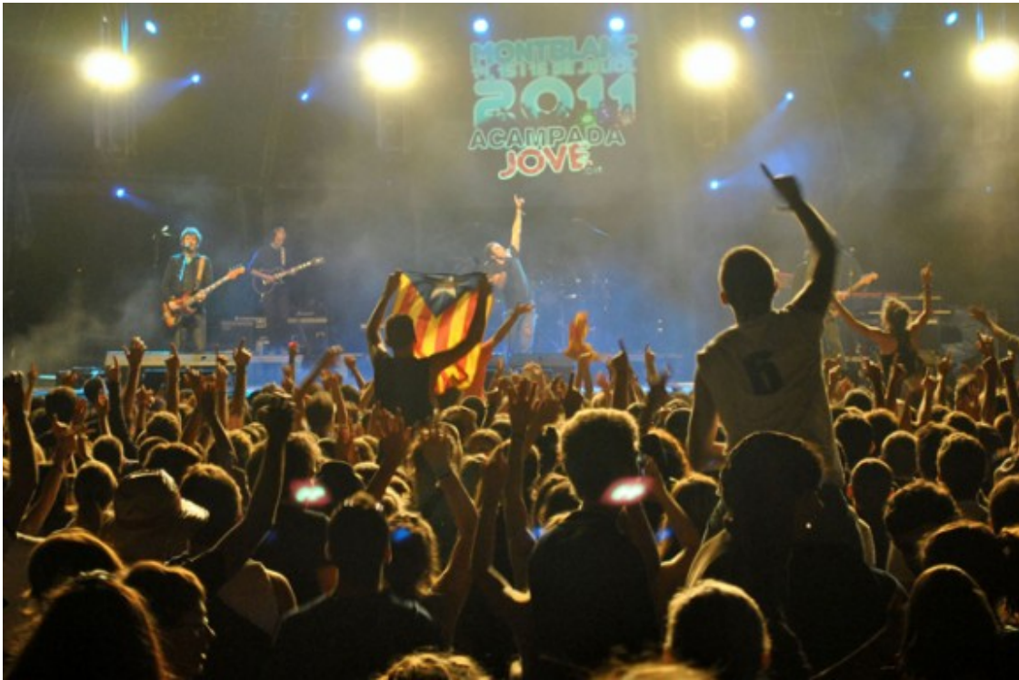
Els Lax'n'Busto en ple concert a l'Acampada Jove 2011.