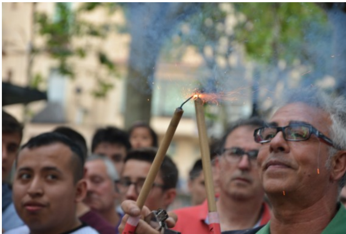
Encesa dels fuets de les Maces.

La Patum d'aquest any serà excepcional, i és que l'últim dia del Corpus berguedà coincidirà amb la celebració de la revetlla de Sant Joan. En aquest cas, i preveient que dilluns serà un dia festiu, el consistori ha organitzat una revetlla que inclourà un concert amb el grup El Kiwi & La Tropikal Band i una sessió musical amb la PD YU. L'esdeveniment es farà a la plaça de Mossèn Huch a partir de la mitjanit, per tal que aquells per qui no és imprescindible ser a plaça, puguin gaudir d'una alternativa.