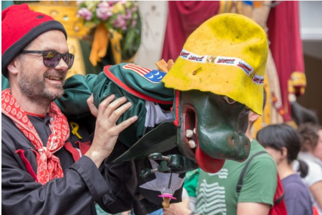
La Guita Xica amb barret.

per a Android ( https://play.google.com/store/apps/details?id=com.lapadrina.lapatum ) i iOS ( https://apps.apple.com/us/app/la-patum/id1464512302?mt=8&ign-mpt=uo%3D4 ).