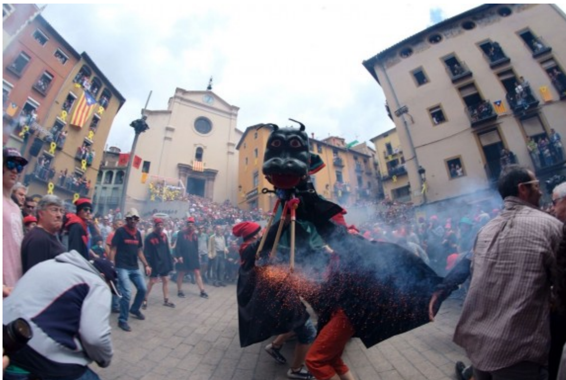
Les espurnes i la pólvora de les Guites sempre són protagonistes.