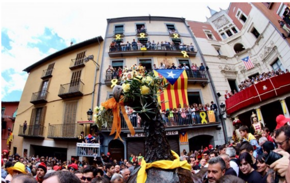
Patum de Lluïment 2018.