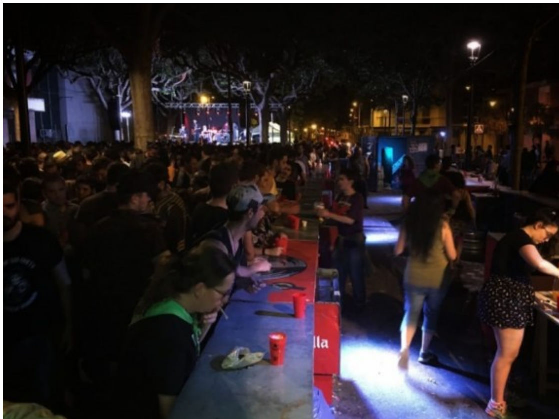
Barres del concert de Patum (arxiu).

Dissabte es farà el concert jove de la Patum organitzat per l'àrea de Joventut i diverses entitats locals que s'encarregaran de gestionar el servei de bar durant l'esdeveniment. Des de les 9 de la nit, per l'escenari del Passeig de la Indústria, passaran cinc grups i bandes de diversos estils musicals: Wildeers, Obeses, Besos de Perro, Roba Estesa i Thug Life Band. L'esdeveniment musical no només està pensat per a què el públic gaudeixi, sinó que també permet evitar que hi hagi una gran afluència de gent al passacarrers, fent que la gent es reparteixi i que tingui un espai d'interès on acudir quan acaba la passada.