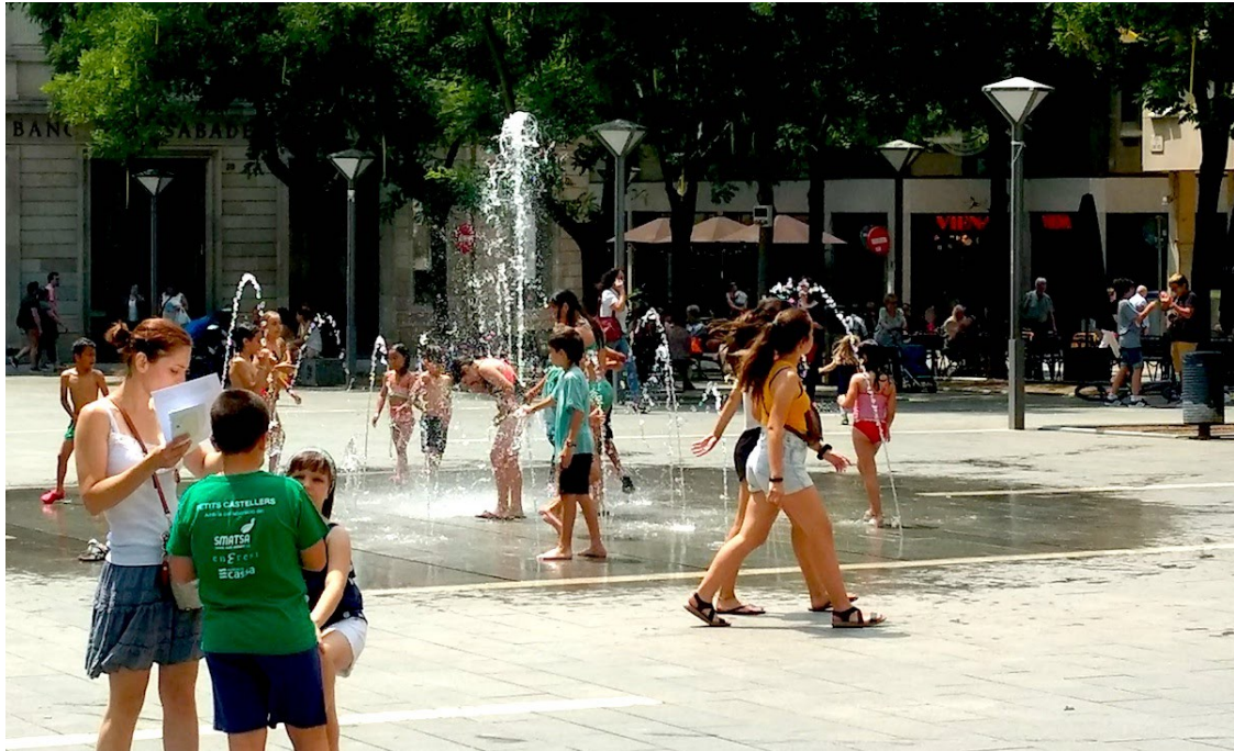
Gent remullant-se a Sabadell | Albert Segura

La revetlla es preveu tranquil·la i amb un clima estiuenc arreu del país