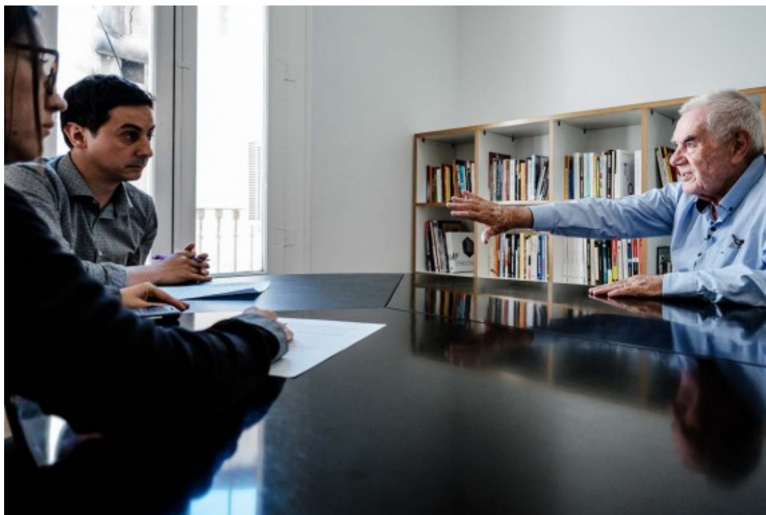
Ernest Maragall està disposat a quedar-se a l'oposició si no és alcalde

fàcil convertir-la en un projecte polític, de governació, de gestió i de construcció de país. És aleshores quan et comences a trobar amb dificultats, previsible en termes d'acció política i institucional. Ara s'ha posat de manifest arreu. A Barcelona també. La força, potència i la capacitat de seducció del moviment, que passa de plataformes i activisme a una proposta de governació, sembla que ha trobat els seus límits i no ha trobat la capacitat d'expressar-se en termes de gestió institucional.