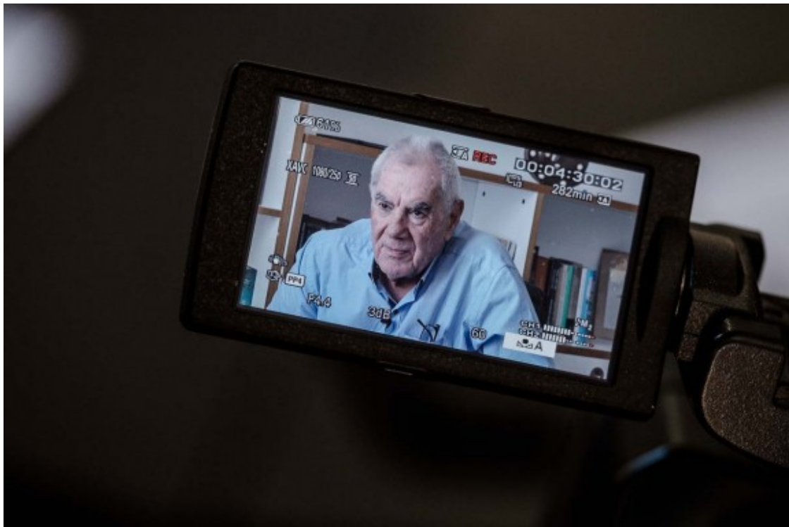
L'alcalde d'ERC creu que el projecte dels comuns queda tocat després del cicle electoral

- Potser sóc ingenu i confio massa en la racionalitat política, la coherència, els valors i els principis que tothom diu assumir i respectar. També perquè sé que hi ha encara un recorregut possible. I, en tercer lloc, no hi ha només una opinió pública, sinó que estic bastant convençut que si es preguntés als votants de Barcelona en Comú quina és la seva opinió, en aquests moments guanyaria l'opció de fer govern amb ERC. És la meva especulació, no dic que hagi de ser una veritat científica. Però pel que veig, el que sento i el que em diuen, no he trobat massa gent que justifiqui l'altra possibilitat.