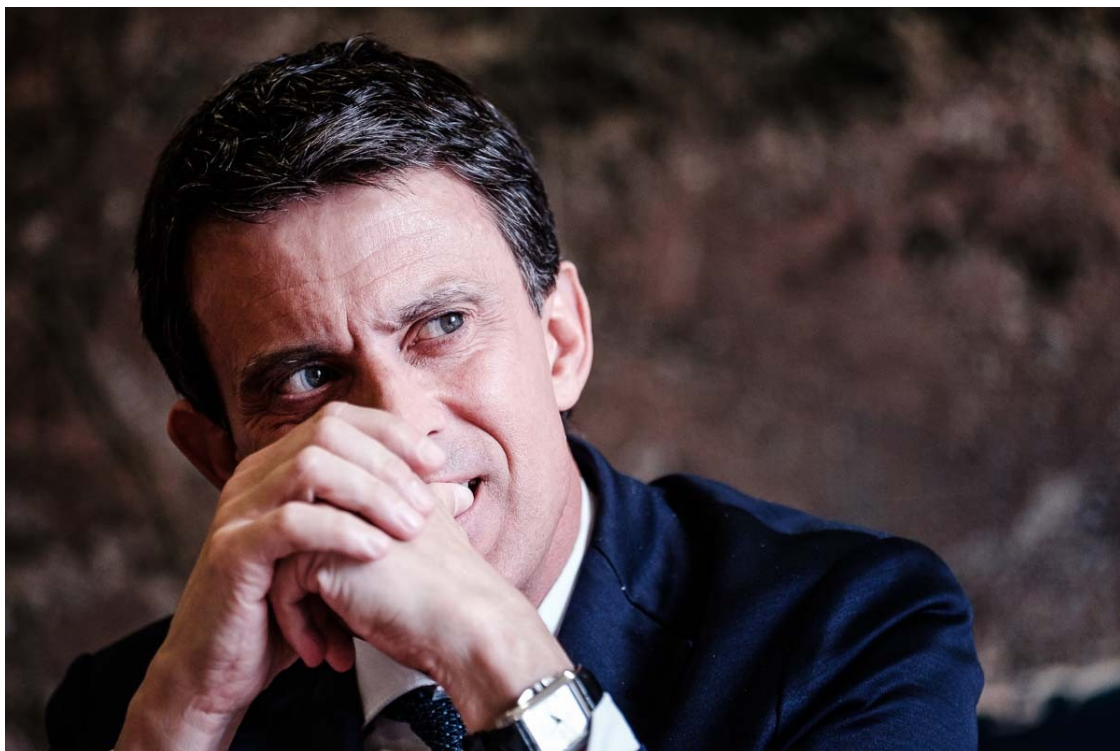
Manuel Valls, en una imatge d'arxiu

En una enquesta feta per l'institut d'investigació independent Odoxa, el 54% dels francesos el veu com el pitjor polític, per davant de Marine Le Pen i Jean-Luc Mélenchon