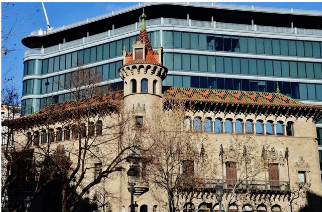
L'edifici de la Diputació de Barcelona

Republicans i socialistes sumen 16 diputats i JUNTS queda en tercer lloc amb 7 representacions