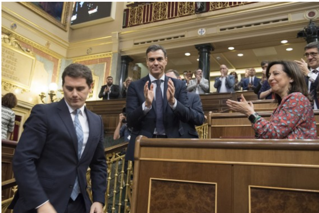
Pedro Sánchez i Albert Rivera, al Congrés dels Diputats

taronja és el PSC. Tant Miquel Iceta com Meritxell Batet han descartat per complet una entesa d'aquestes característiques, malgrat que una abstenció del partit taronja seria numèricament suficient perquè Sánchez fos investit en segona volta.