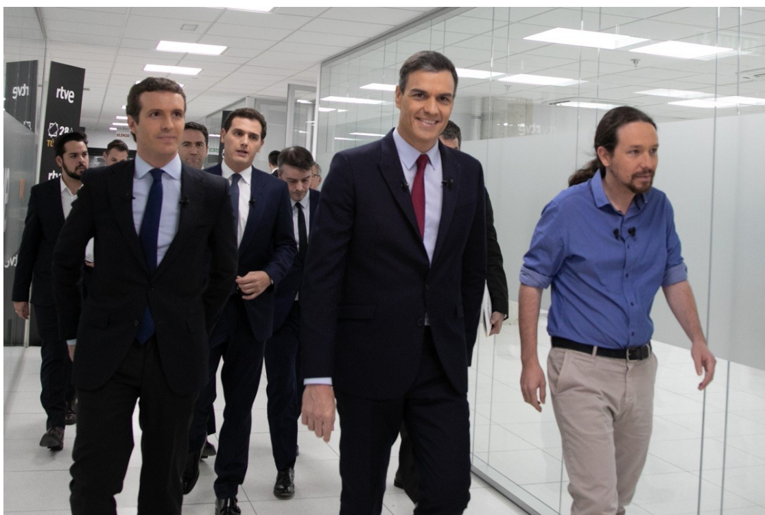
Pedro Sánchez amb Pablo Casado, Pablo Iglesias i Albert Rivera, el dia del debat a TVE

Les negociacions per la investidura no començaran fins passades les eleccions del 26 de maig, però els partits ja han explicat quin serà el seu marge actuació