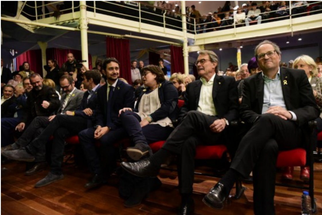
Miting final de Junts per Catalunya a Tarragona