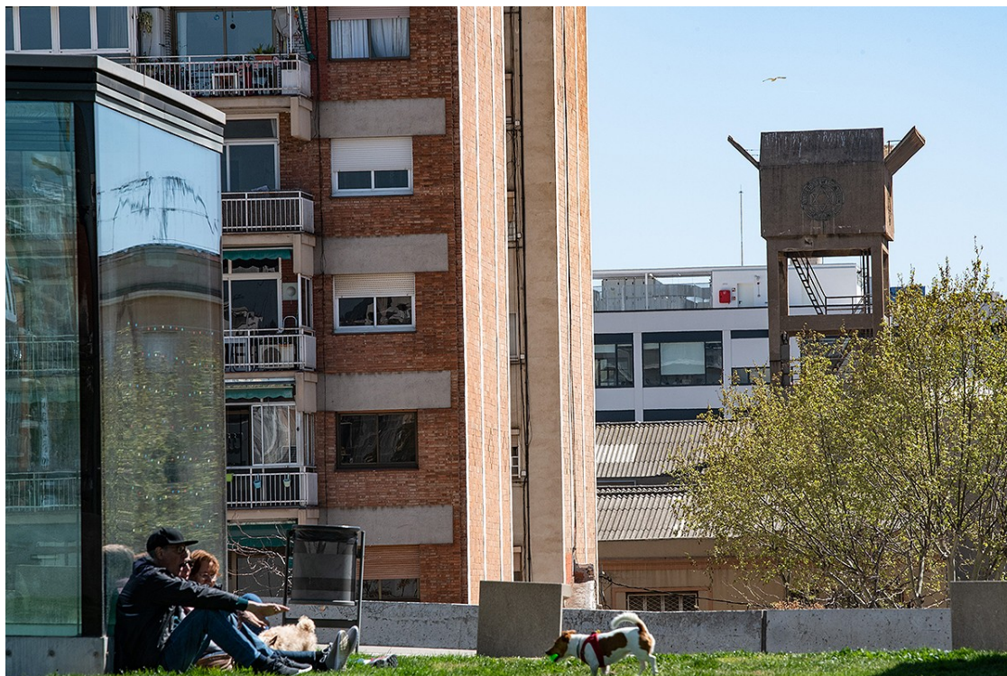
Dipòsit d'aigües del carrer Dávila

El vestigi d'una antiga cartroneria amb final tràgic a la zona del 22 @