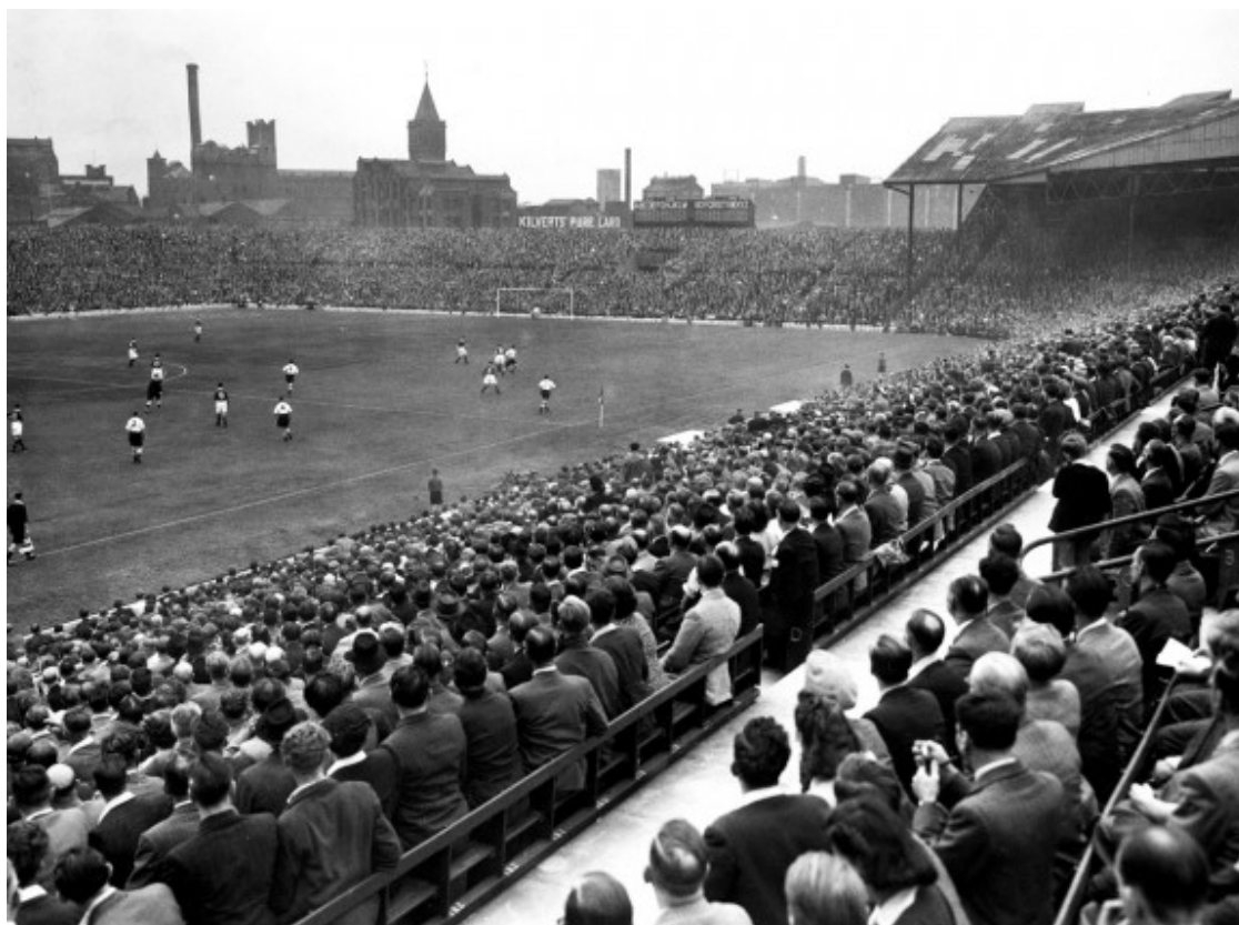
Primer partit del MUFC al reconstruït Old Trafford el 1949