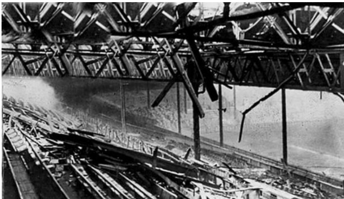
La tribuna d'Old Trafford destruïda per les bombes nazis el 1941

Un dels bombardejos més cruels va ser el que va patir Manchester poc abans del Nadal de 1940. La nit del 22 de desembre d'aquell mateix any, l'aviació de Hitler va llençar milers de bombes sobre la ciutat, atacant alguns dels seus llocs més simbòlics com és el cas de la catedral, del teatre Royal Exchange o de la sala pública Free Trade Hall.