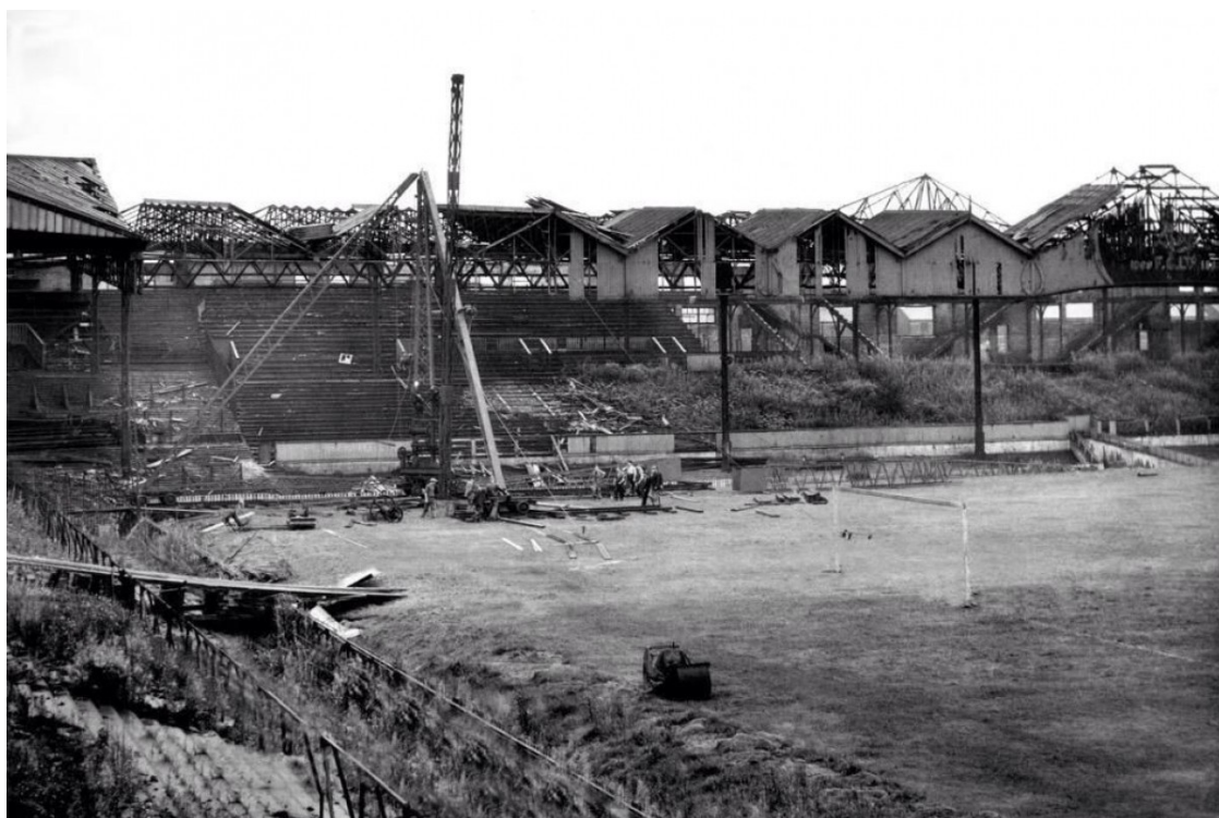
Treballs de reconstrucció a Old Trafford després de la Segona Guerra Mundial | MUFC

L'estadi del United, un equip profundament vinculat a la història industrial de Manchester, va patir dos atacs de la Luftwaffe que van allunyar els «red devils» de casa seva durant gairebé una dècada