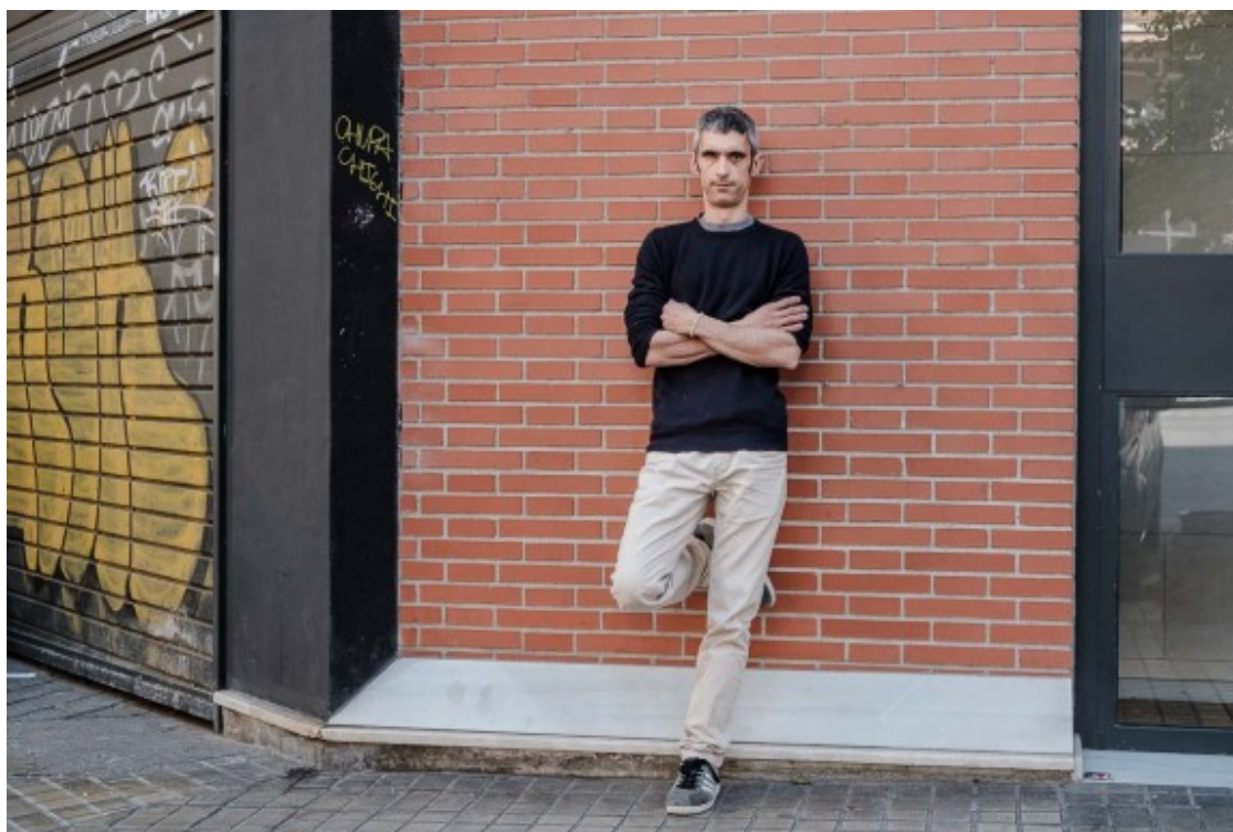
Español és el número 5 de la candidatura de Front Republicà

Si bé es declara "decebut" amb les polítiques -no pel tracte- de JxCat i ERC, amb qui comparteix objectiu però no "les formes", Español també manifesta incomprensió amb el paper de Jaume Asens com a cap de llista d'En Comú Podem. "Com a acusació particular en la causa judicial dels ferits de l'1-O ens dona molta força, per això no entenc què fa Asens, obertament sobiranista, amb els comuns. Em sap greu perquè és un valor que s'està deixant perdre Catalunya", afirma.