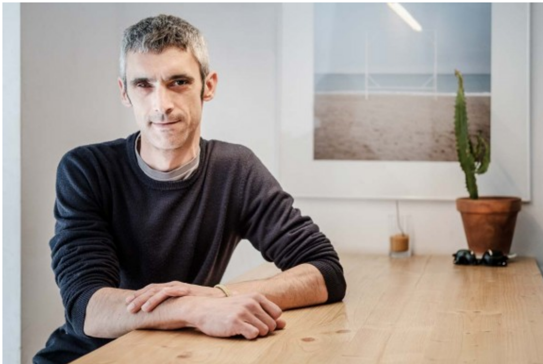
L'activista és partidari de la via de la desobediència per implementar el resultat de l'1-O

Amb quin dirigent de l'estat espanyol li agradaria fer un cafè si arriba a ser diputat? "Amb tots. Els posaria la meua cara davant la seva. Als socialistes és a qui menys ganes tinc d'explicar-los res, els veig massa falsos. Almenys els del trifachito van de cara i hi tindria més coses a confrontar", respon. Afegeix que no busca la "comprensió" de ningú ni d'aquells que l'han considerat un "dany col·lateral" de l'acció policial per impedir un referèndum considerat il·legal. "És massa tard perquè em compreguin", conclou.