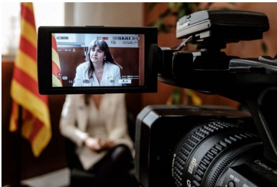
La consellera de Cultura posa rumb a Madrid com a número dos de JxCat.

Hem de veure, en aquest escenari de complexitat, quin és el paper que podem jugar nosaltres defensant, naturalment, els interessos de Catalunya. Amb l'exigència del final de la repressió: sempre dic que és estranyíssim haver d'exigir que s'acabi la repressió en un estat que es diu democràtic. I que s'escolti i s'atengui el dret a l'autodeterminació que demana el poble de Catalunya, que ho fa de manera molt constant des de fa molt de temps i cada cop amb més consens. La gent vol poder decidir què vol ser, i això només pot passar en el marc democràtic. No ho podem entendre d'una altra manera.