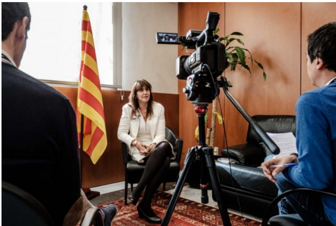
La consellera de Cultura va ser la més votada de la direcció fundacional de la Crida.