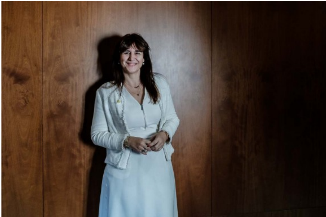
La dirigent de la Crida va atendre NacióDigital des dels despatxos de JxCat al Parlament.