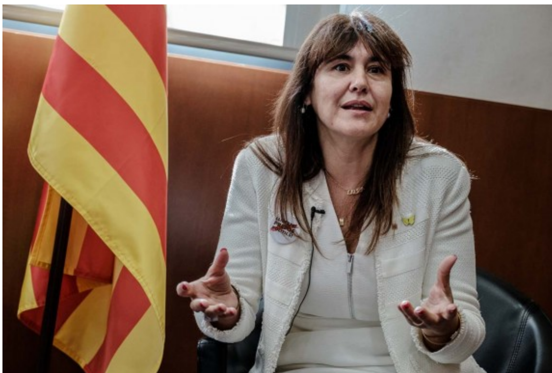
Abans d'entrar a les llistes de JxCat al Parlament era directora de la Institució de les Lletres Catalanes.