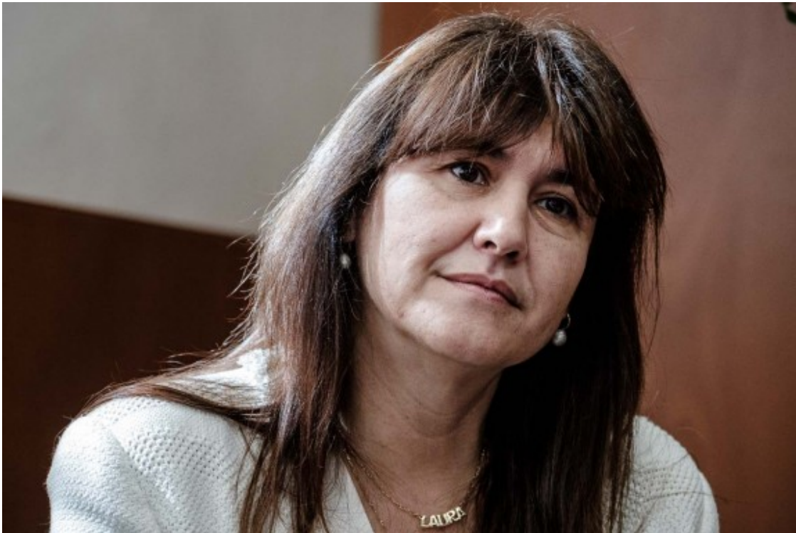
Borràs forma part del nucli dur de Quim Torra al Govern.