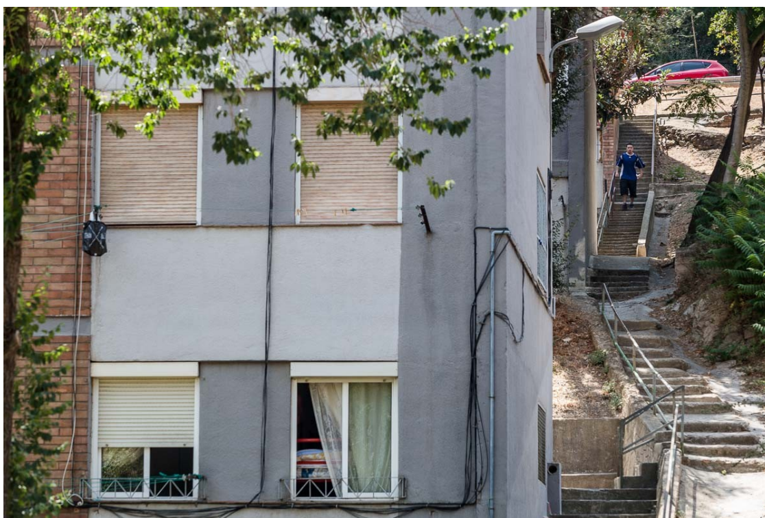
Grups criminals venen claus de pisos ocupats | Adrià Costa

NacióDigital ha investigat durant dos mesos la venda il·legal d'habitatges buits a persones en situació d'emergència habitacional i ha contactat amb un dels grups criminals que se'n lucra