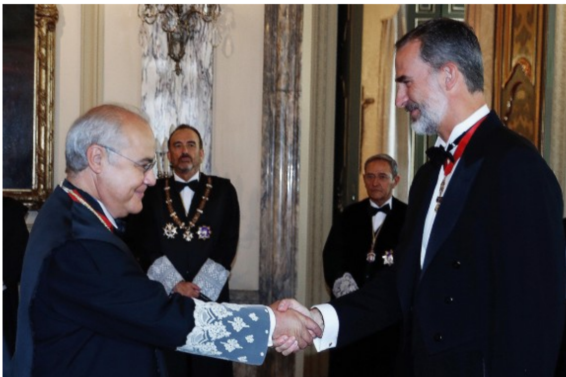
El magistrat del Suprem, Pablo Llarena, amb el rei d'Espanya Felip VI.

La figura de Pablo Llarena ha estat molt qüestionada durant la instrucció del cas. Malgrat ser considerat en un principi un jutge de prestigi i de tarannà més progressista que no pas la jutgessa que primer va veure el cas a l'Audiència Nacional, Carmen Lamela, les decisions que ha pres aquests últims mesos i certs comportaments l'han posat a l'ull de l'huracà. Els presos han presentat diverses recusacions contra ell perquè no el consideren imparcial, però no n'ha prosperat cap.