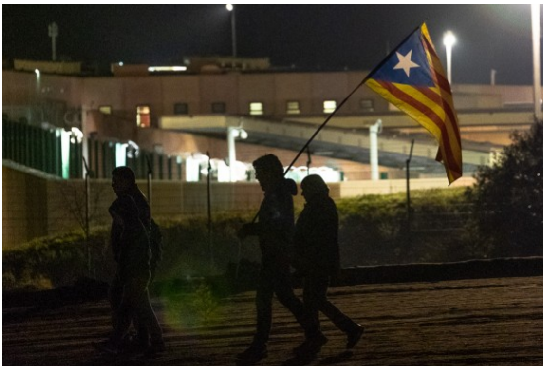
Manifestants a l'exterior de la presó de Lledoners

La presó preventiva és una mesura cautelar privativa de llibertat que sempre ha generat debat. Encara més, però, quan la seva aplicació és tan qüestionada com ha estat en aquest cas, sobretot des del sobiranisme i les defenses. L'adequació legal d'aplicar-la en determinats casos, i de no fer-ho en d'altres, ha comportat diverses crítiques del món penal així com d'entitats de drets humans. Es tracta d'una mesura altament restrictiva que ha d'estar molt ben justificada, ja que vulnera un dret fonamental, com és el de la llibertat. Els supòsits per aplicar-la han de justificar-se per un risc de fuga que posi en perill el compliment de la pena, la reiteració delictiva amb forts indicis de culpabilitat i el perill de destrucció de proves.