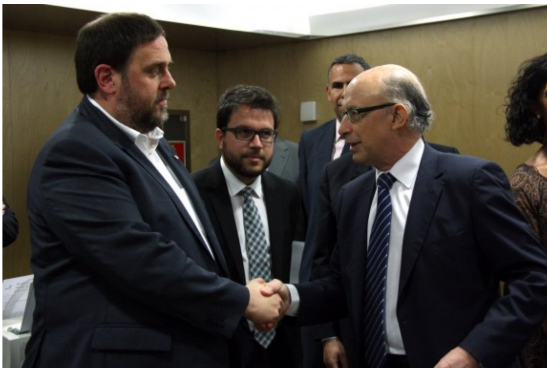
Oriol Junqueras i Cristóbal Montoro, en una reunió del consell de política fiscal i financera

L'exministre d'Hisenda, Cristóbal Montoro, no es pensava que acabaria assenyalat per Ciutadans acusat de col·laborar amb l'independentisme. Els líders independentistes són sospitosos, a ulls de la maquinària judicial i policial espanyola, d'haver malversat diner públic durant el procés, especialment en la celebració del referèndum. El problema és que les finances de la Generalitat estaven controlades des del 2015 i totalment intervingudes des del juliol de 2017, ( https://www.naciodigital.cat/noticia/135327/estat/interv/totes/despeses/generalitat/evitar/referendum ) quan la conselleria d'Economia havia de comunicar al ministeri en què es gastaven els diners.