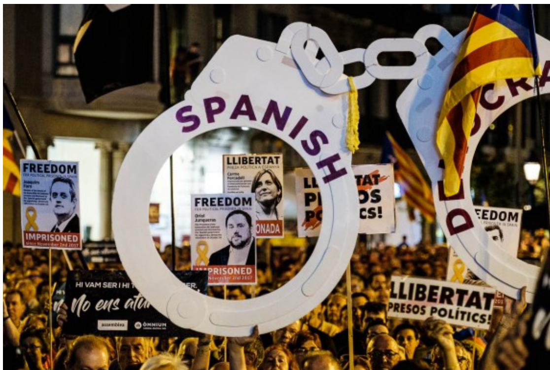
Concentració davant del Departament d'Economia