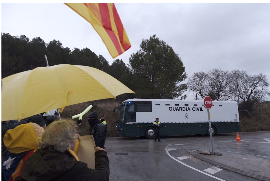
El trasllat dels presos a Madrid | Josep M. Montaner

La instrucció de Llarena, àmpliament criticada per les defenses, condicionarà un judici al Suprem que acabarà amb recursos a Estrasburg quan es dicti sentència