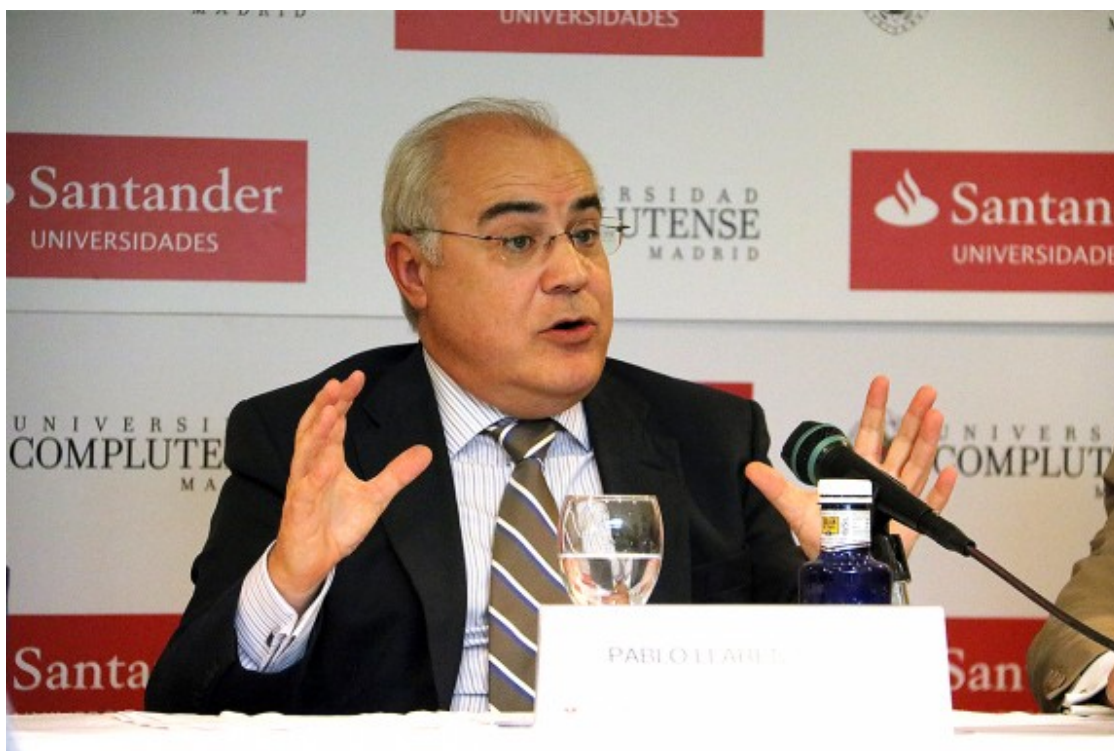
Pablo Llarena, en una conferència

La gestió de les euroordres també ha estat molt criticada. Les primeres van ser emeses per la jutgessa Lamela ( https://www.naciodigital.cat/noticia/141958/audiencia/nacional/ordena/detenir/puigdemont/belgica ) des de l'Audiència Nacional i tots els afectats -Carles Puigdemont, Toni Comín, Meritxell Serret, Clara Ponsatí i Lluís Puig- es van presentar davant la justícia, que va acordar deixar-los en llibertat amb mesures cautelars. Quan el cas va saltar al Suprem, Pablo Llarena va decidir retirar-les. Al maig de l'any passat, el jutge instructor del Suprem les va reactivar quan Puigdemont va ser detingut a Alemanya. Puigdemont, que va passar 12 dies a la presó, va comparèixer davant la justícia de Schleswig-Holstein, que va acordar deixar-lo en llibertat amb mesures cautelars ( https://www.naciodigital.cat/noticia/152132/puigdemont/llibertat/es/moment/fer/politica ) i, finalment, va acceptar l'extradició per malversació però va rebutjar la rebel·lió. ( https://www.naciodigital.cat/noticia/159173/alemanya/accepta/extradir/puigdemont/malversacio )