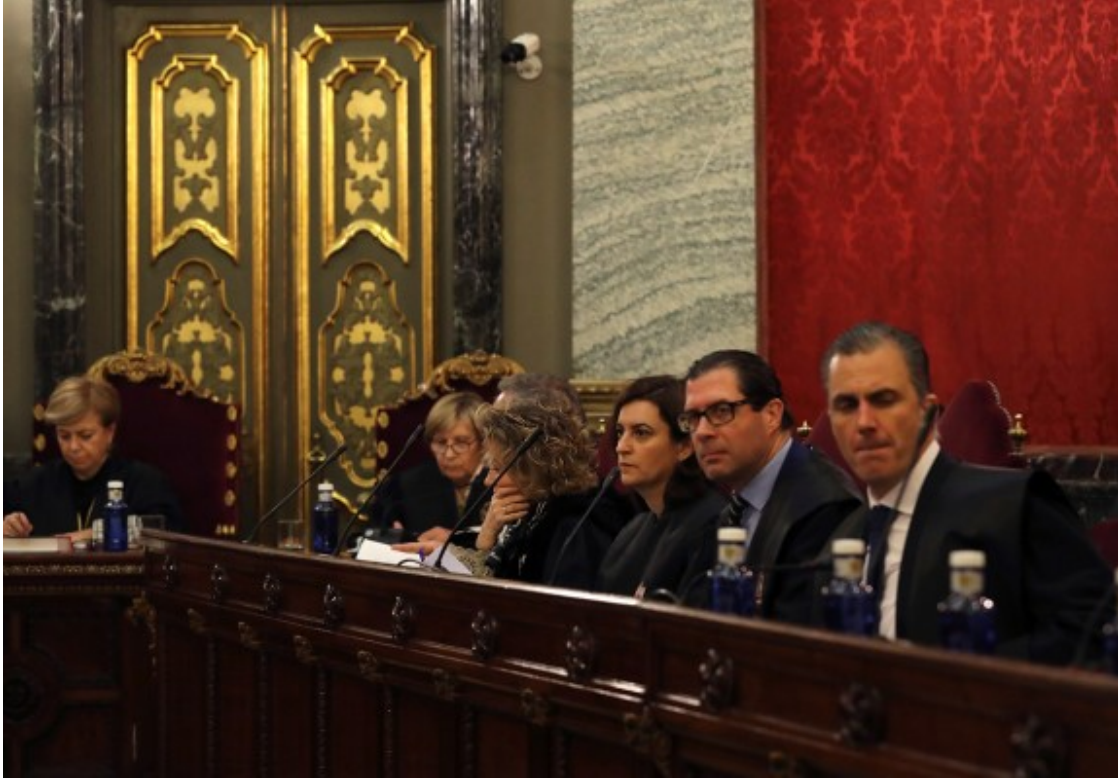
Les acusacions al judici de l'1-O

Un dels elements més controvertits de la instrucció del judici és l'acusació de rebel·lió que han fet la Fiscalia i Vox i que ha assumit el magistrat Pablo Llarena.