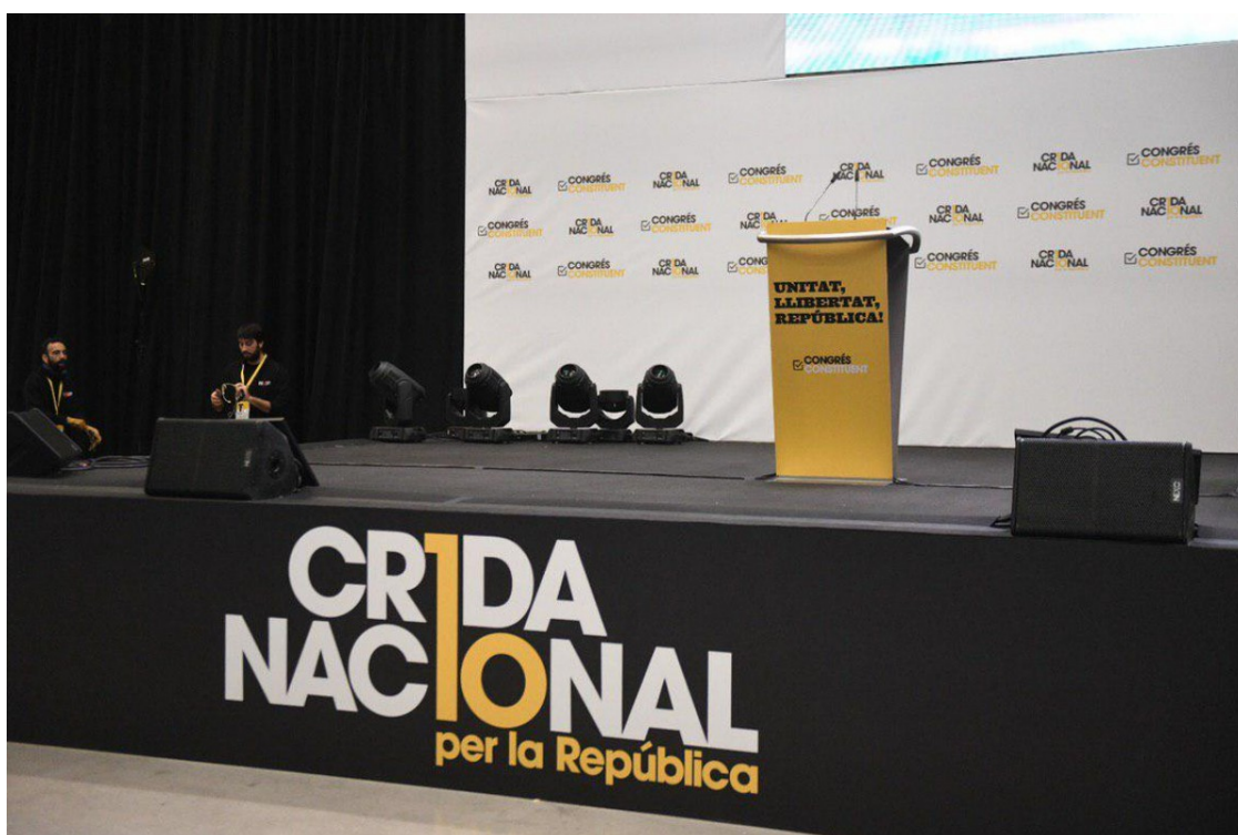
Congrés constituent de la Crida Nacional per la República

El nou moviment de Puigdemont, ja registrat com a partit però que reforçarà el perfil associatiu, celebra el congrés constituent a Barcelona i entronitzarà la direcció liderada per Sànchez, Morral i Artadi