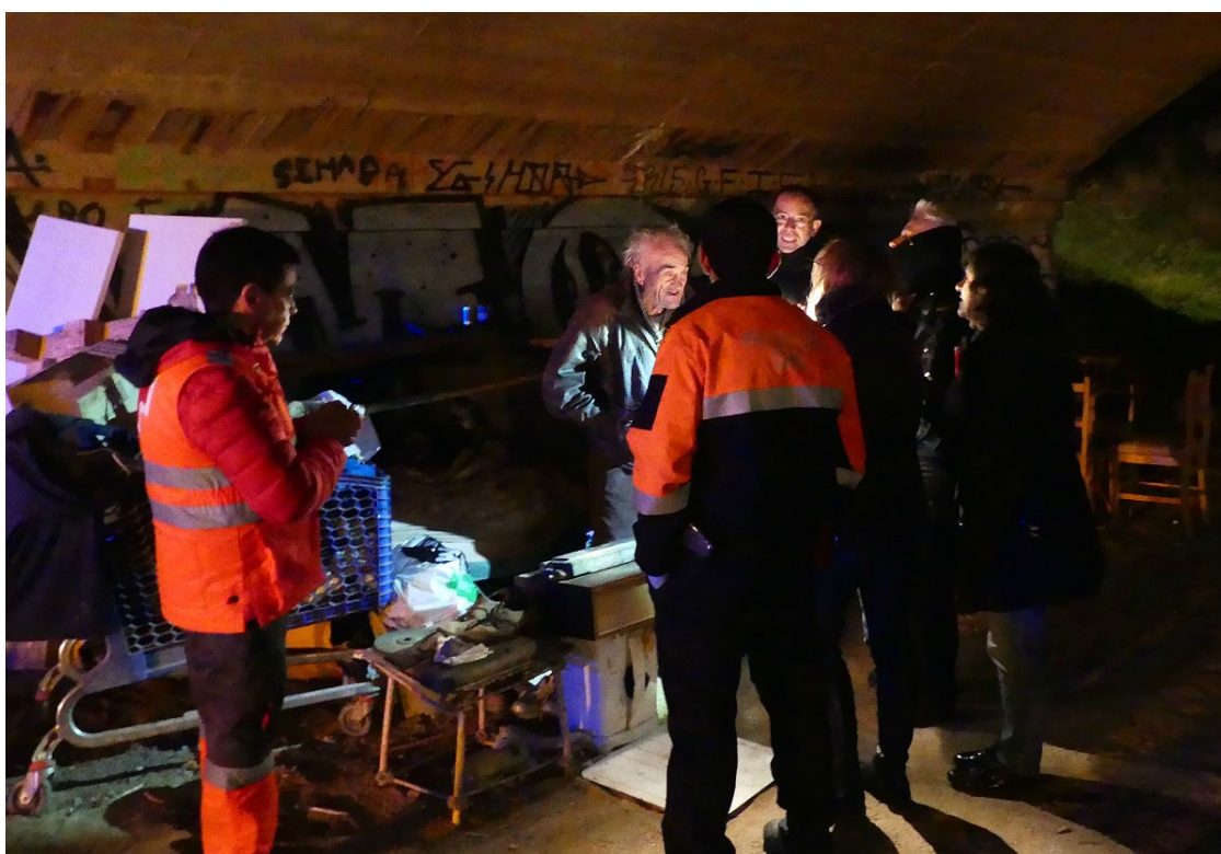
Una persona sense sostre atesa durant l'Operació Iglú a Tarragona | Jonathan Oca

NacióDigital acompanya durant aquesta matinada els serveis d'emergència de Tarragona