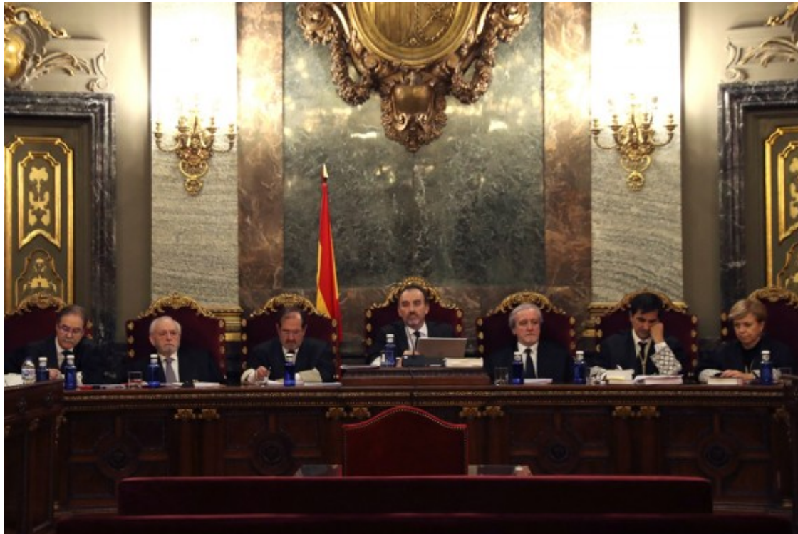
Els magistrats del Suprem, durant la vista del passat dia 18