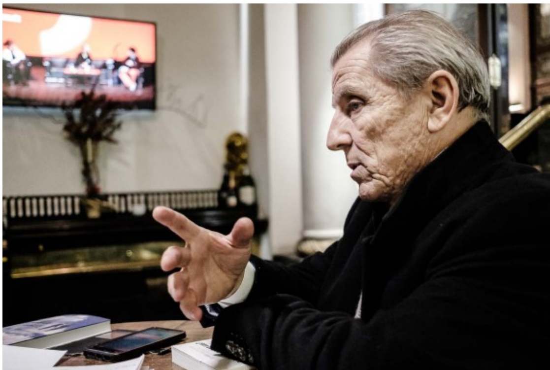
Manuel Conthe durant l'entrevista al Círculo de Bellas Artes.