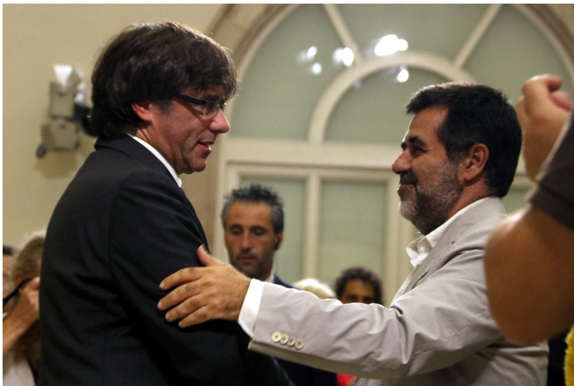
Jordi Sànchez i Carles Puigdemont, durant la tardor de l'any passat

Empresonat a Lledoners, serà el màxim dirigent executiu del nou moviment, fins al punt que és el principal interlocutor en les negociacions amb el PDECat per encaixar els dos projectes