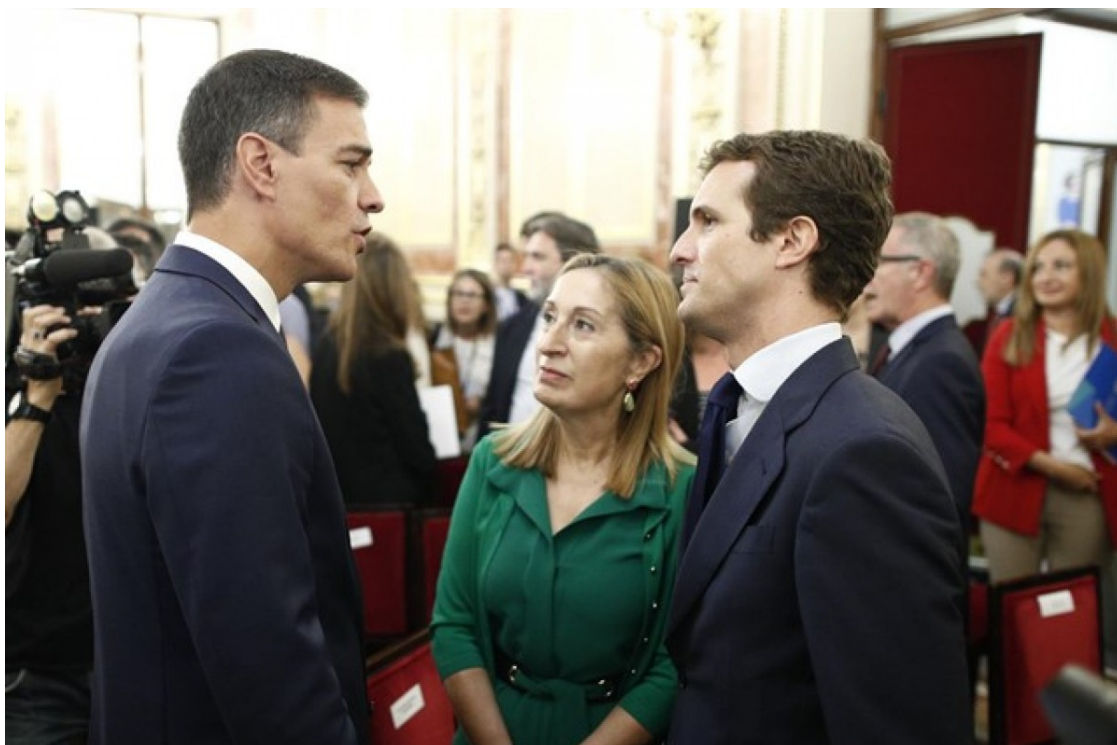
Pedro Sánchez, amb Pablo Casado i Ana Pastor

L'actual cúpula judicial queda abocada a una pròrroga del seu mandat a l'espera d'un acord polític o un canvi legislatiu