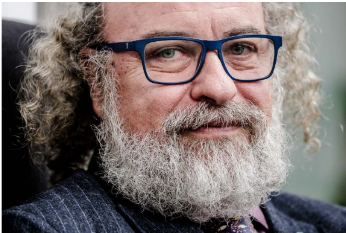
Amadeu Recasens, Comissionat de Seguretat de l'Ajuntament de Barcelona

- En moments de crisi com l'actual és important tenir més presència policial, però això no arregla el problema de fons. En relació als pisos on hi ha narcotràfic, per exemple, el problema original és que hi ha pisos buits. Fins ara hem demanat a les instàncies que tenen competències que s'intervinguí droga al port, que Mossos i Guàrdia Urbana investiguin i que el departament de Justícia contribueixi a que els pisos no puguin reobrir immediatament. Cal buscar solucions, no alarmar-nos. Abordar els conflictes derivats de la drogodependència només amb mesures repressives i punitives, no resoldrà el problema.