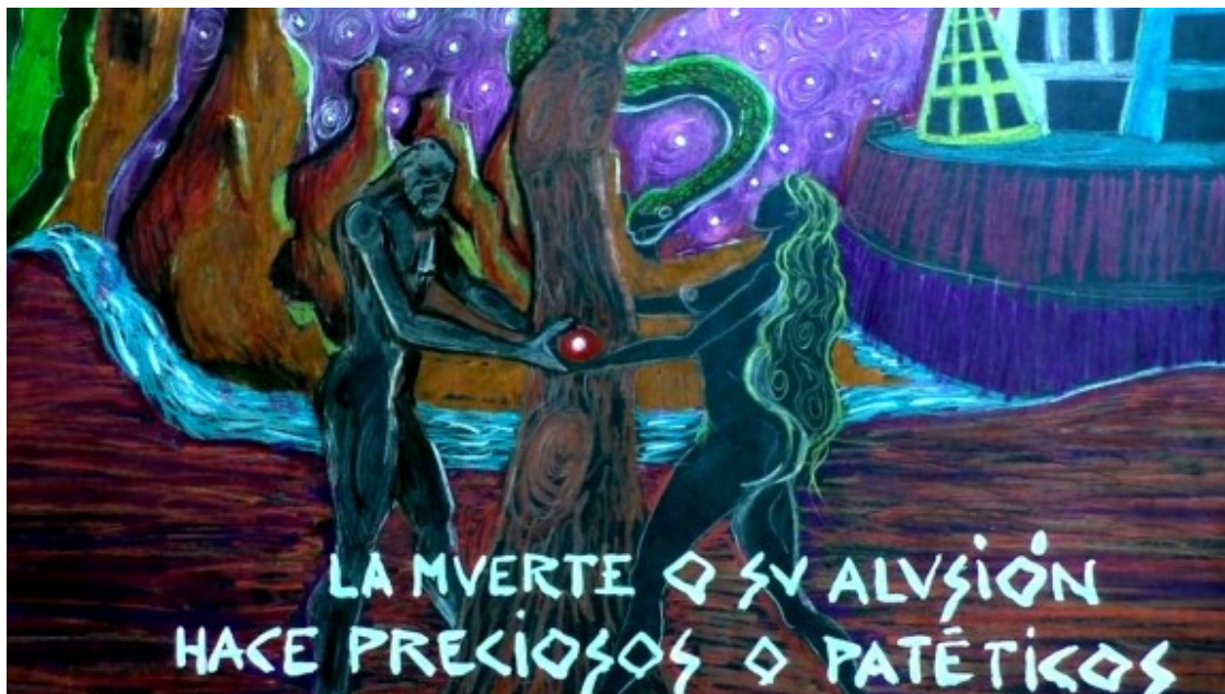
Les il·lustracions d'un dels interns que protagonitzen un dels curts