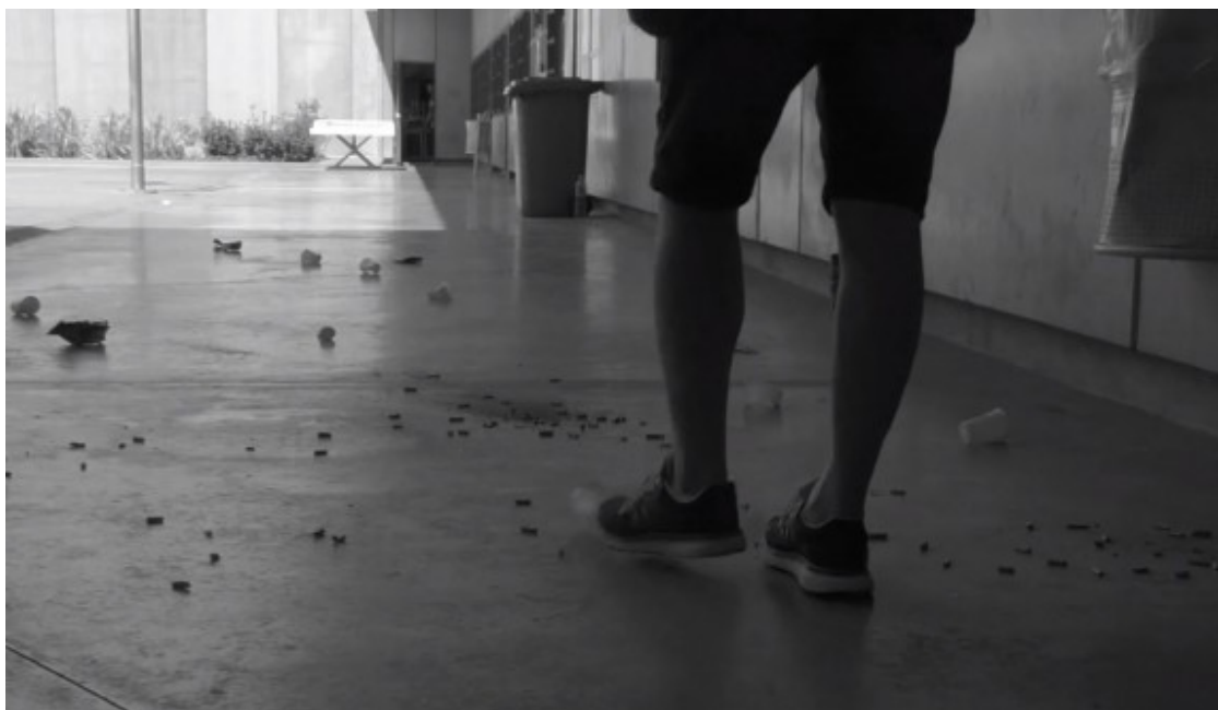
Frame d'un altre dels curts presentats en el marc del festival

"Veient l'èxit que van tenir els curts, ja estem mantenint contacte amb alguns festivals de cinema social de la Catalunya Central per veure si podem presentar-nos-hi", diu Rodríguez, tot afegint que si això passés "seria molt enriquidor tant pels mateixos presos com per la gent que els veïés". En aquest sentit, exposa, en les projeccions fora reïxes "també hi podrien assistir els interns acompanyats d'algun educador o educadora i explicar les seves vivències en viu i en directe, pot crear-se un debat entre públic i reclusos molt interessant". És per això que el manresà espera que "el festival tingui continuïtat".