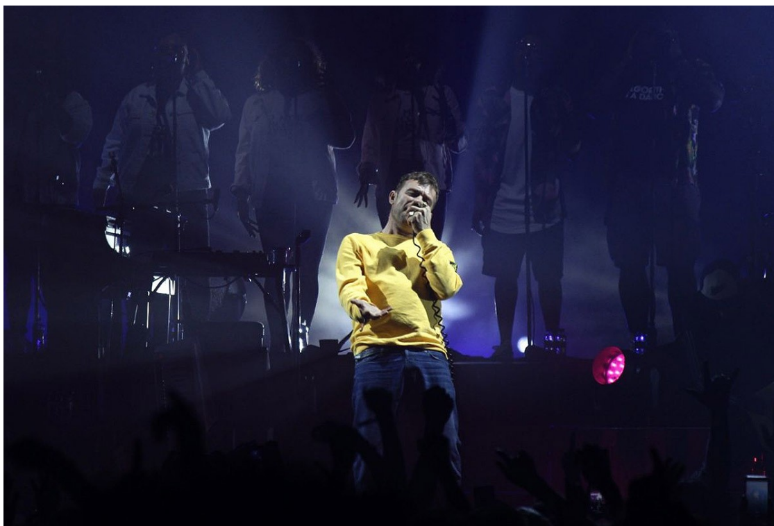
Damon Albarn, de Gorillaz, en acció al Sónar 2018

La jornada de divendres ha mostrat un gran catàleg de vibracions intenses, confirmacions i descobertes