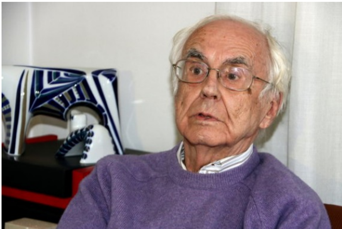
Josep Maria Espinàs

L'escriptor ha manifestat que no ha planificat mai res però tampoc s'ho ha proposat. "Jo no m'he proposat ser escriptor", ha assegurat. En canvi, s'ha trobat vivint, s'ha trobat amb les coses i les ha acceptat. "He tingut sort que he trobat coses que puc recordar amb una satisfacció suficient, no pas amb orgull". Ha considerat que ell ha estat "un acceptador". "Jo he acceptat la vida, no l'he volgut conduir ni aprofitar i m'he trobat fent coses perquè estava prou obert per no dictar sentències". Espinàs considera que ha arribat "on havia d'arribar".