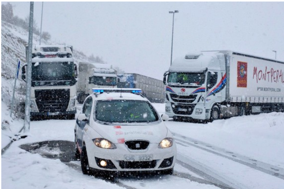
Els camions continuen aturats fins a nova ordre.

- Consulta en directe els problemes de trànsit ( http://cit.transit.gencat.cat/cit/AppJava/views/incidents.xhtml )