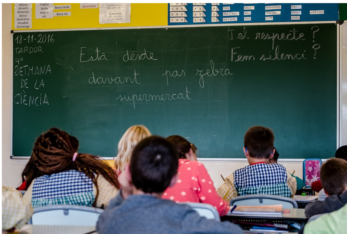
Alumnes durant una classe

Estudis d'Ensenyament i també internacionals, com l'informe PISA, evidencien la tendència en augment dels bons resultats del model educatiu a Catalunya que prioritza la competència lingüística, també en castellà, la cohesió social i el nivell acadèmic de l'alumnat