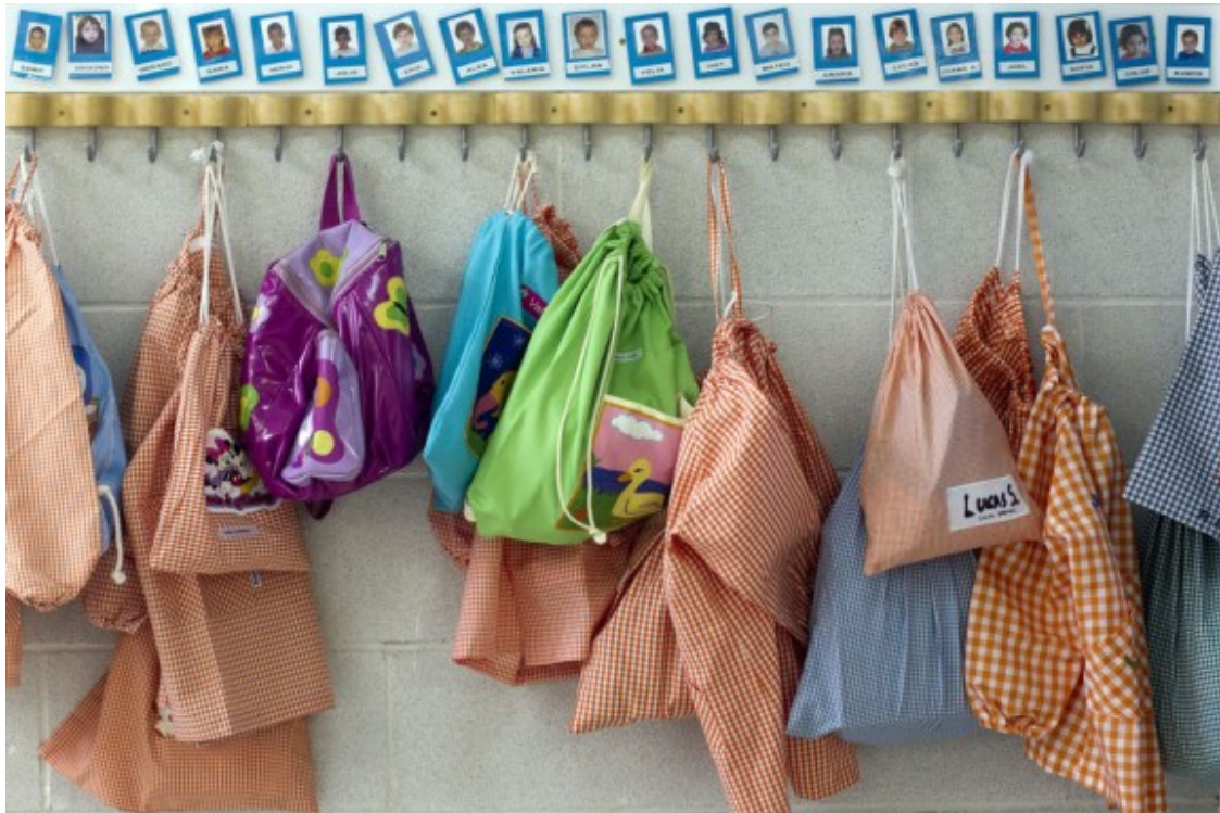
Aula d'una escola de Matadepera.