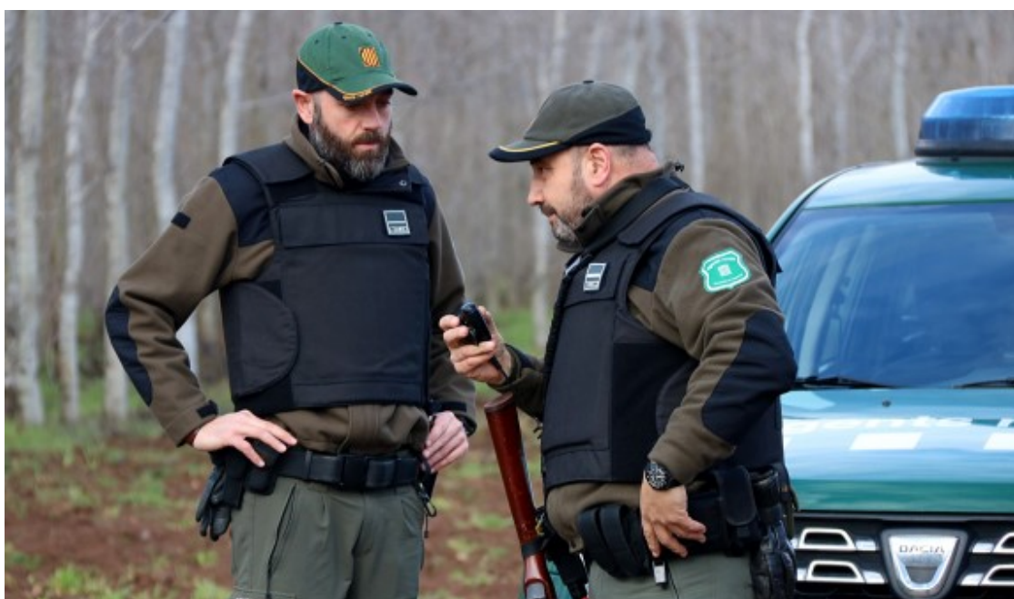
Imatge de dos agents amb armes i armilles

Arran de la tragèdia, disminueixen més d'un 25% les inspeccions de caça a Catalunya, pel procés de dol i l'augment d'efectius per patrulla