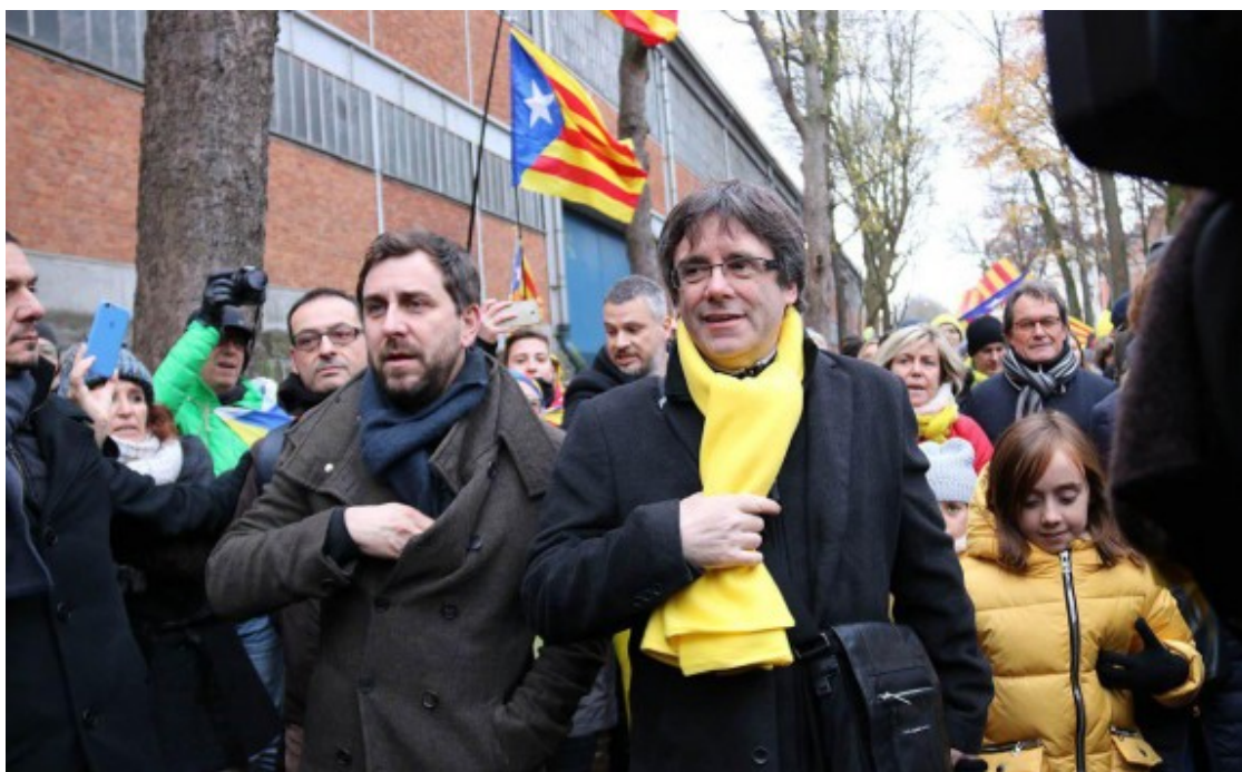
Carles Puigdemont, amb bufanda groga a la manifestació amb Toni Comín.

Brussel·les per portar les seves reivindicacions a la porta, literalment, de les institucions comunitàries. "Volem que passin coses, que Europa ens escolti", explicava fa uns dies un dels promotors de la idea. Entre els 45.000 manifestants hi destaca la presència del president Carles Puigdemont que ha arribat amb una bufanda groga en suport als presos polítics, així com dels quatre consellers a l'exili i representants de les entitats i els partits independentistes.