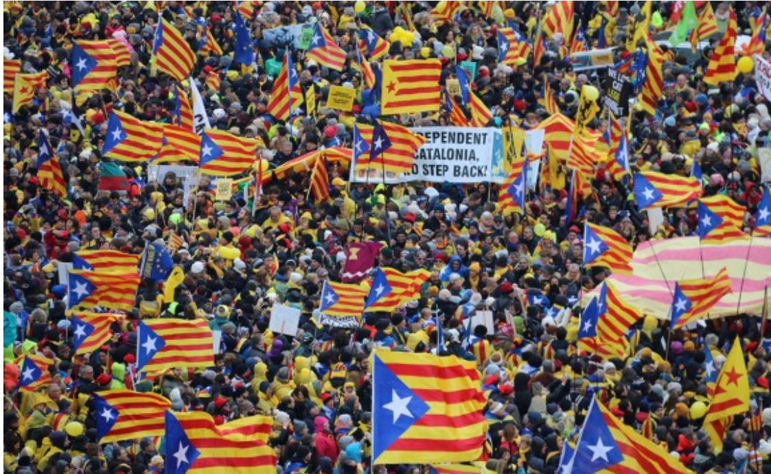
Imatge general de la manifestació «Omplim Brussel·les» el 7 de desembre a la capital europea.

A continuació, recull de fotos i vídeos de la manifestació.