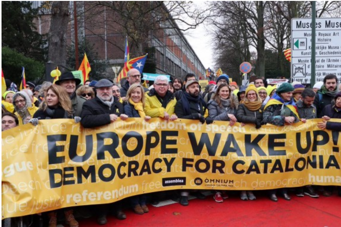
Capçalera de la manifestació independentista a Brussel·les

VÍDEO Sonen «Els Segadors» al cor de la Unió Europea. Milers d'estelades i pancartes exigint una resposta a la qüestió catalana omplen els carrers de Brussel·les https://t.co/CIAELYPv2Q ( https://t.co/CIAELYPv2Q ) pic.twitter.com/0F8T8VUOmo ( https://t.co/0F8T8VUOmo )