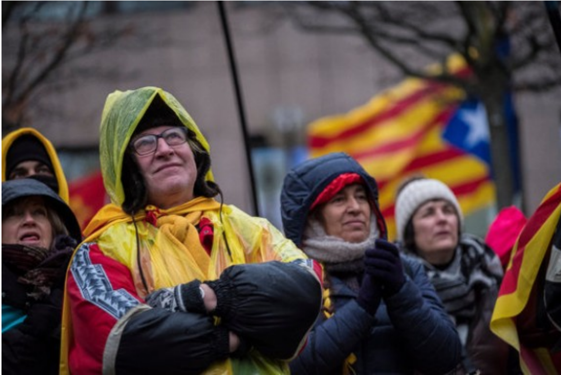
Un grup de participants de la manifestació de Brussel·les, sota la pluja.