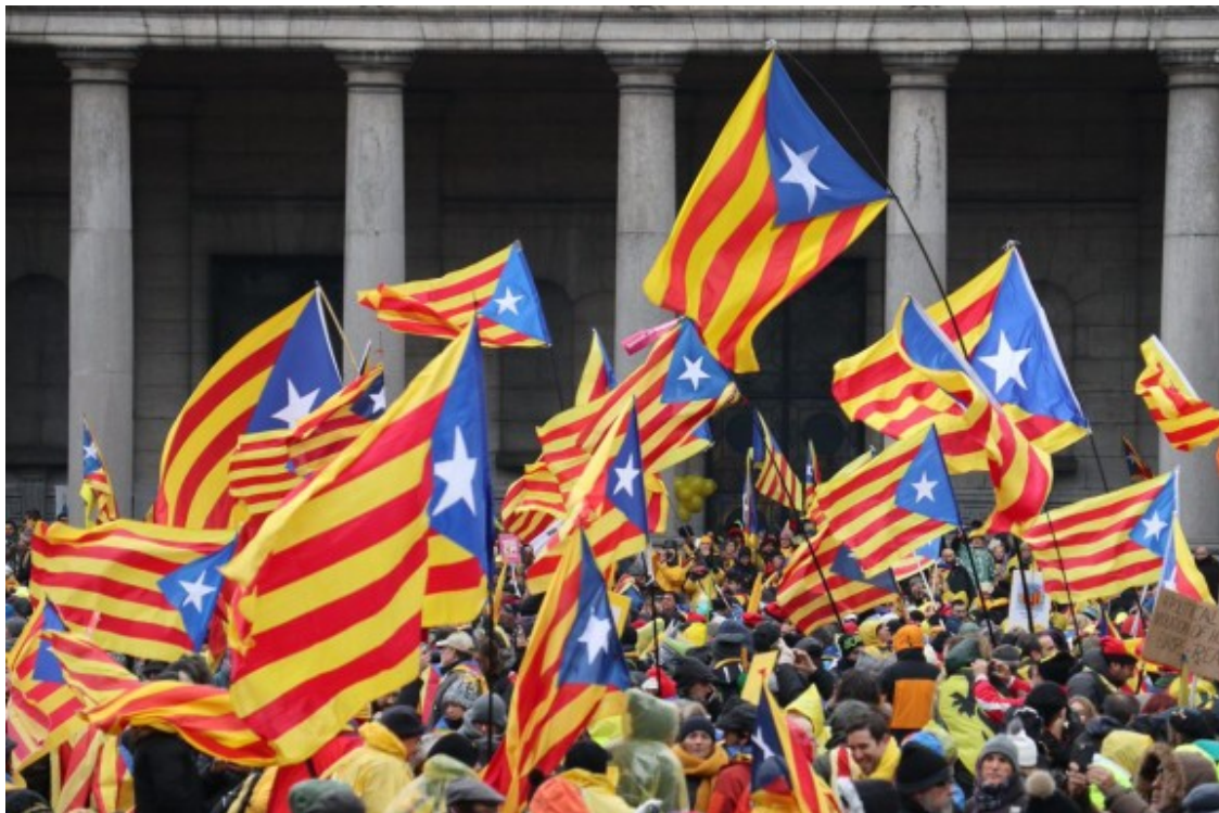
Estelades a Brussel·les.