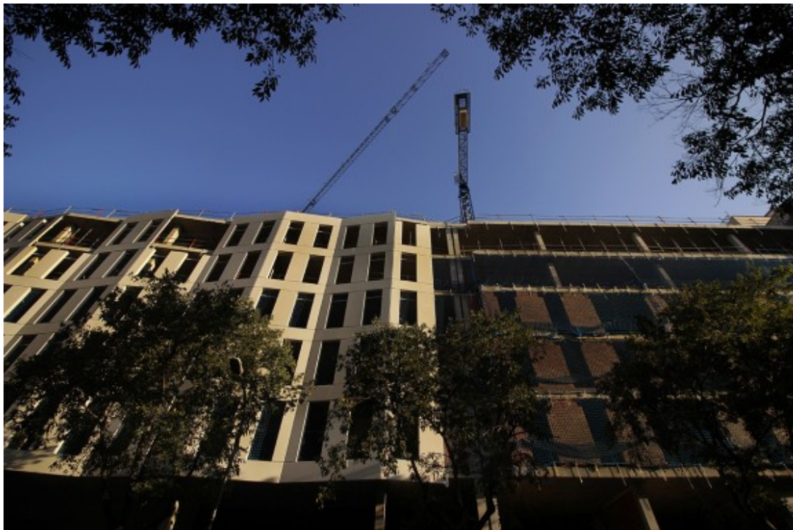
Obres de l'hotel que obrirà on hi havia la Henkel.

El PEUAT està en vigor des del març, i fins llavors la moratòria hotelera havia impedit tramitar 33 projectes d'allotjaments turístics però 74 sí que van prosperar. D'ells, 34 són a l'Eixample, 18 a Ciutat Vella, nou a Sant Martí, set a Sants-Montjuïc, dos a Gràcia, dos a les Corts i dos a Sarrià-Sant Gervasi. Els únics districtes que no havien suscitat l'interès dels hotelers són també els dos que tenen menys pressió turística, Sant Andreu i Nou Barris, i el d'Horta-Guinardó, tot i que ja està acostumat a rebre visitants pels búnquers del Carmel.