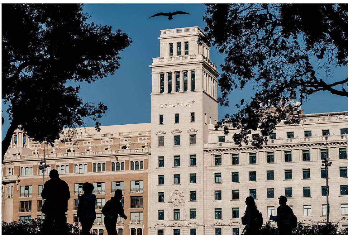
L'hotel Iberostar que obrirà el gener a la plaça Catalunya

En els pròxims mesos es multiplicaran les inauguracions d'establiments turístics que es van salvar de la moratòria del govern d'Ada Colau