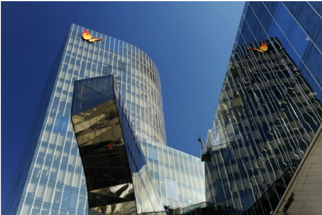
Seu de Gas Natural a Barcelona

Per Modest Guinjoan, "la incidència real en l'activitat econòmica tendirà a zero". "Ni afectarà el PIB ni el sistema fiscal, tampoc els treballadors de les entitats. Però sí que significa que ha entrat en escena el boicot", raona. Guinjoan assenyala un element que ha quedat altre cop en evidència: "S'ha tornat a veure la potència de l'Estat, que en un no-res ha canviat la llei a conveniència aprovant avui mateix un decret. Coses així només passen en països en vies de desenvolupament".