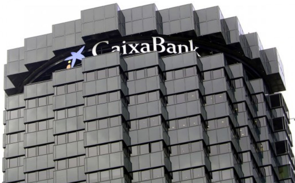
Seu central de CaixaBank a Barcelona.