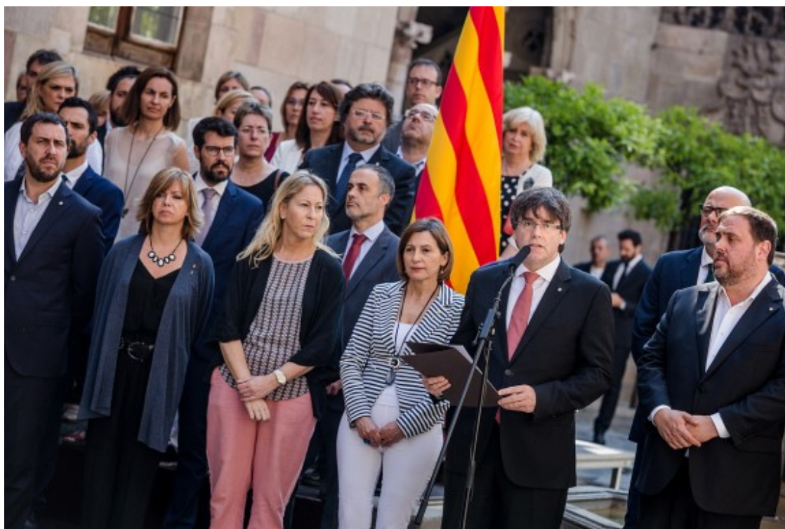
Anunci de la data i la pregunta