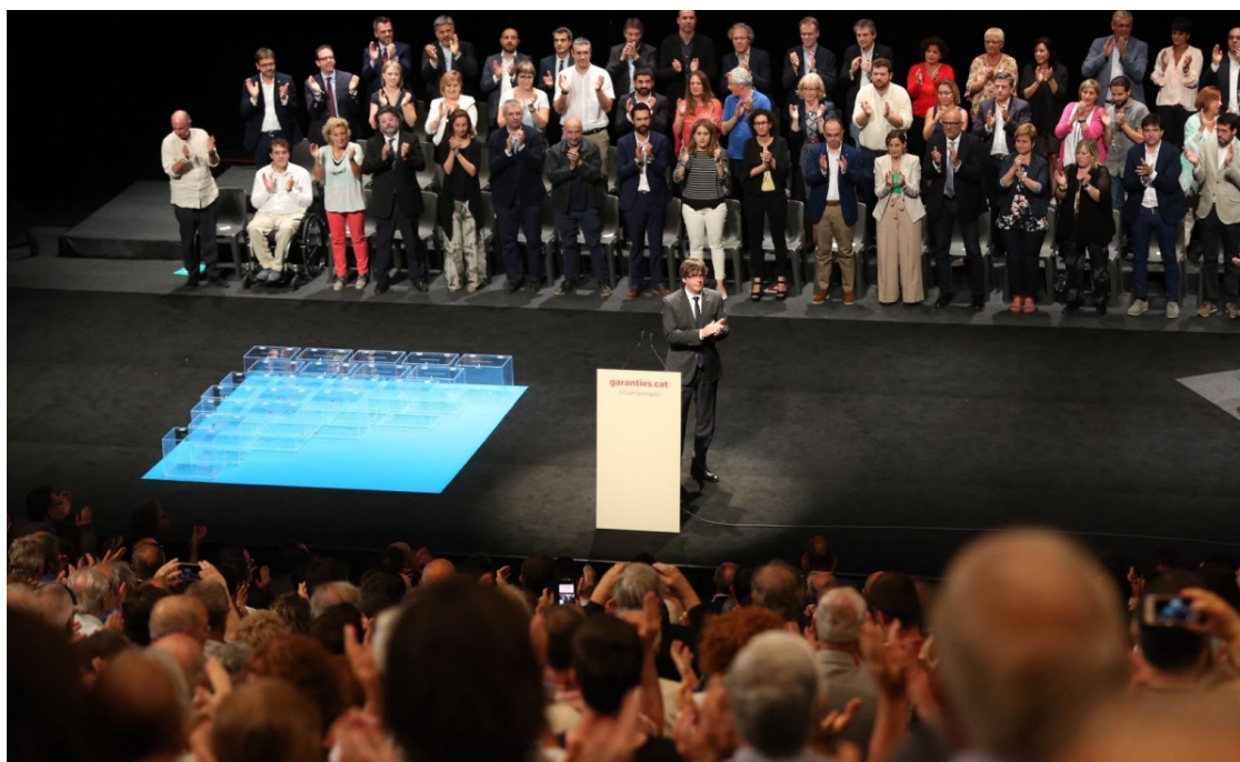
Carles Puigdemont, a l'acte sobre les garanties del referèndum

Un informe de quatre professors d'universitats europees i americanes instat pel Departament d'Exteriors afirma que el referèndum de l'1-O és "legítim" i que la llei que el regula s'adequa a l'estàndard internacional | Des de 1991 s'han fet 53 referèndum per part d'entitats subestats, la meitat d'ells sense acord amb l'estat matriu